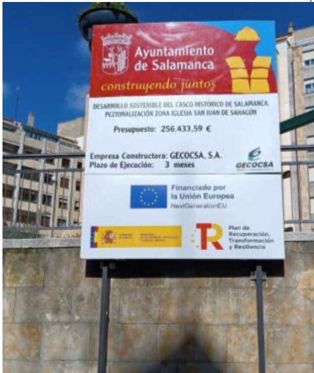
CARTEL Y PLACA