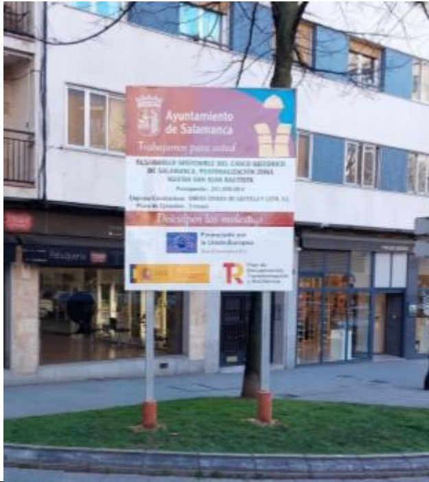
CARTEL Y PLACA