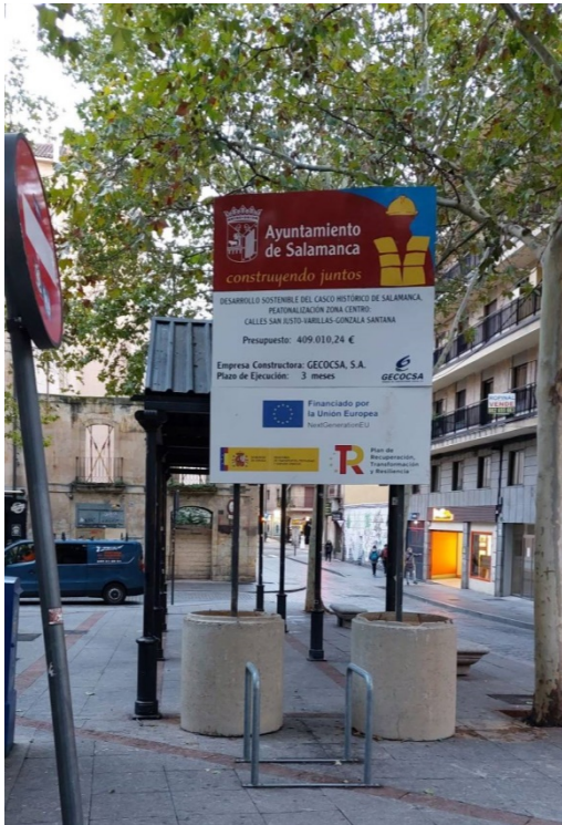
CARTEL Y PLACA