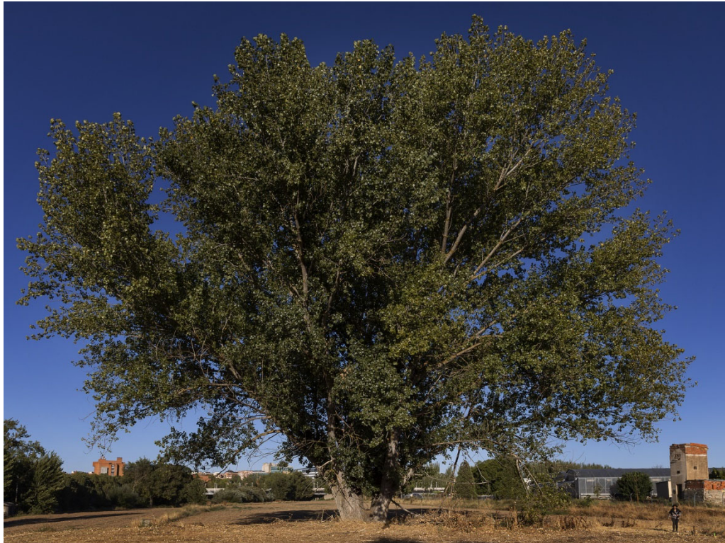
34. Los árboles singulares como patrimonio integral