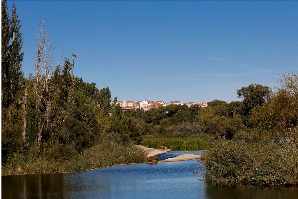
1. Conjunto etnológico pesquera de Tejares