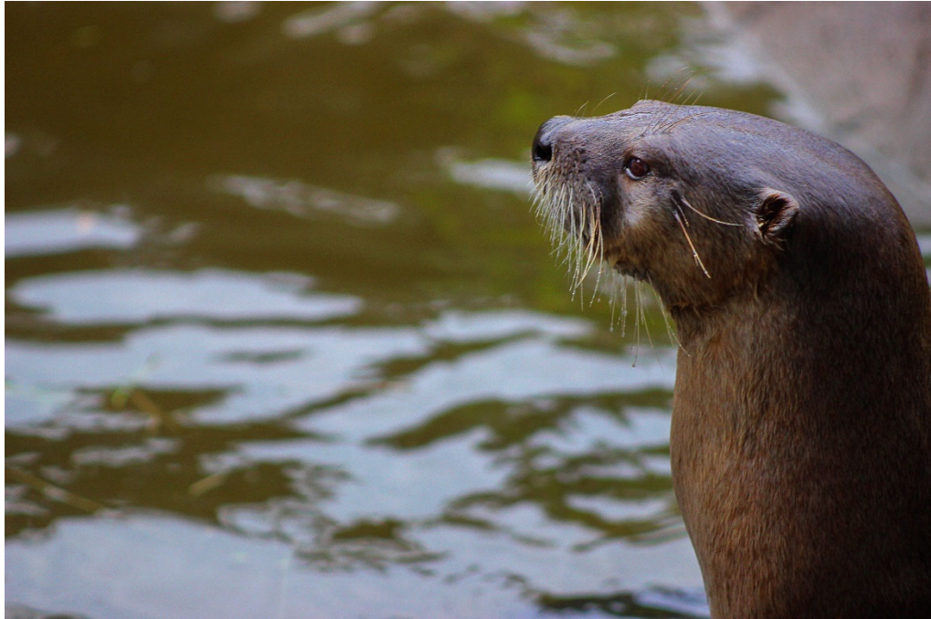
39. Vivir dentro del agua III: Mamíferos del río Tormes (autóctonos e invasores)