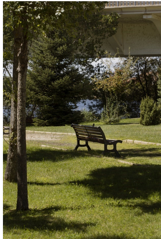
28. Huerta Otea, donde la diversidad se hace jardín