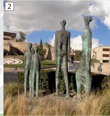
Monumento A la familia.