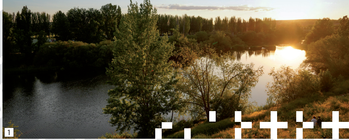
Atardecer en el Tormes.