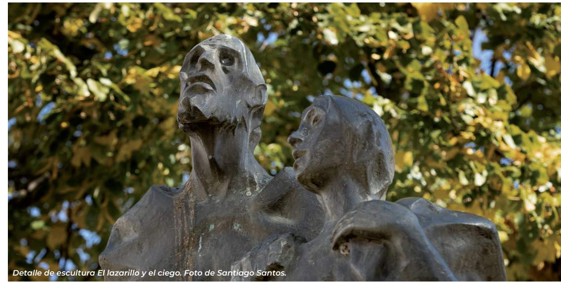
Detalle de escultura El lazarrillo y el ciego.