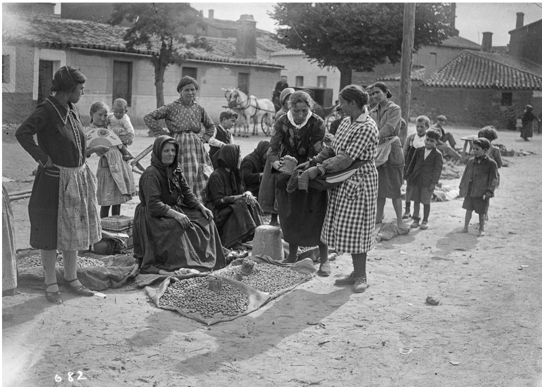
25. La Chana