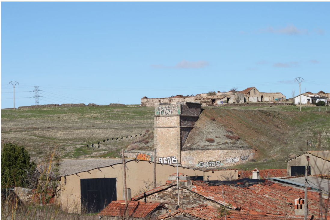
58. Puente de la Salud