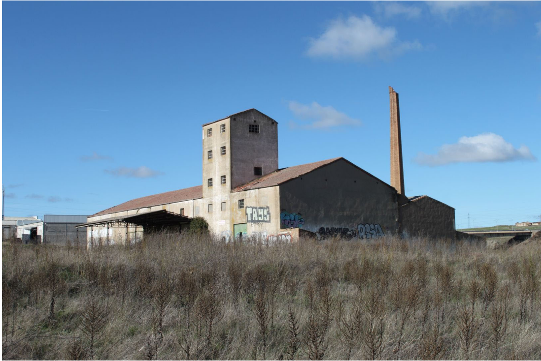
57. Chimenea industrial