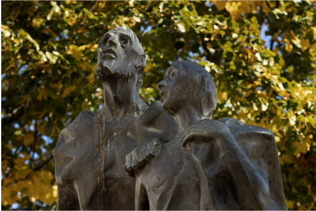
13. El Tormes literario