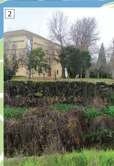
2 Canal de antiguo molino harinero.