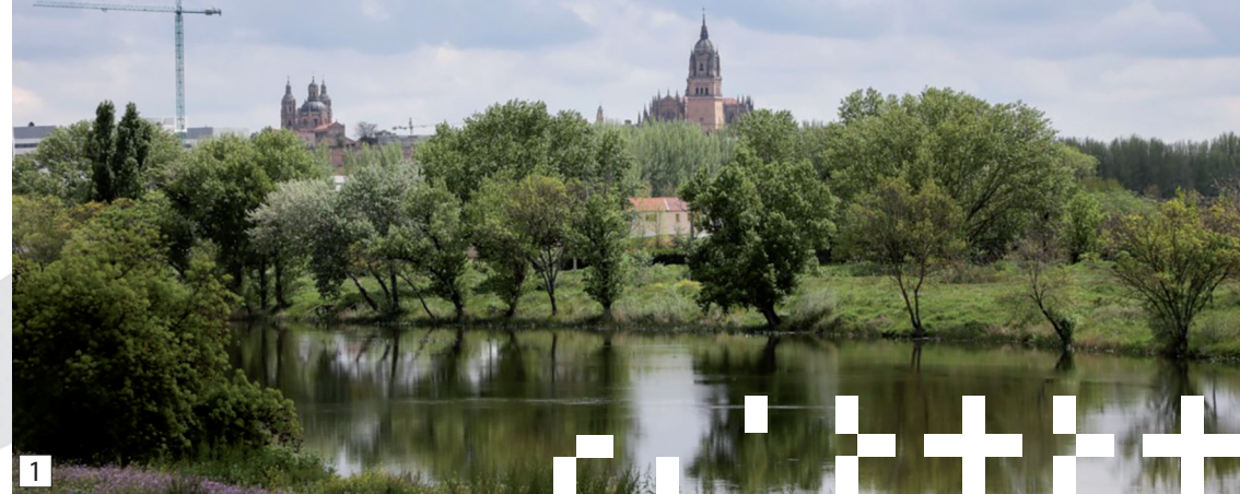
1 Catedral desde Huerta Otea.