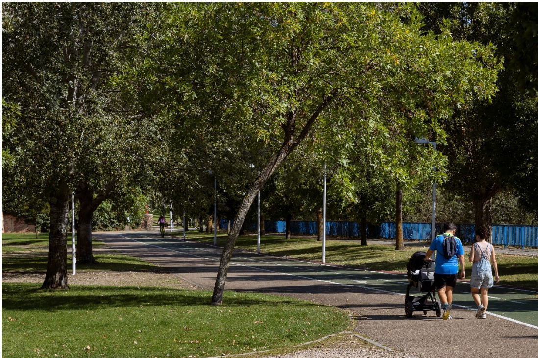
27. Parque Miguel Delibes y Santa Cándida: jardines para recordar