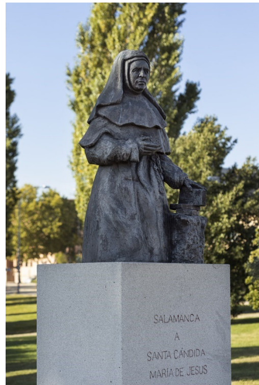
21. Santa Cándida María de Jesús