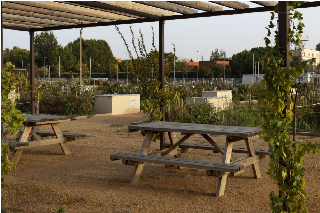
29. Hortelanos de la ciudad. Huertos urbanos