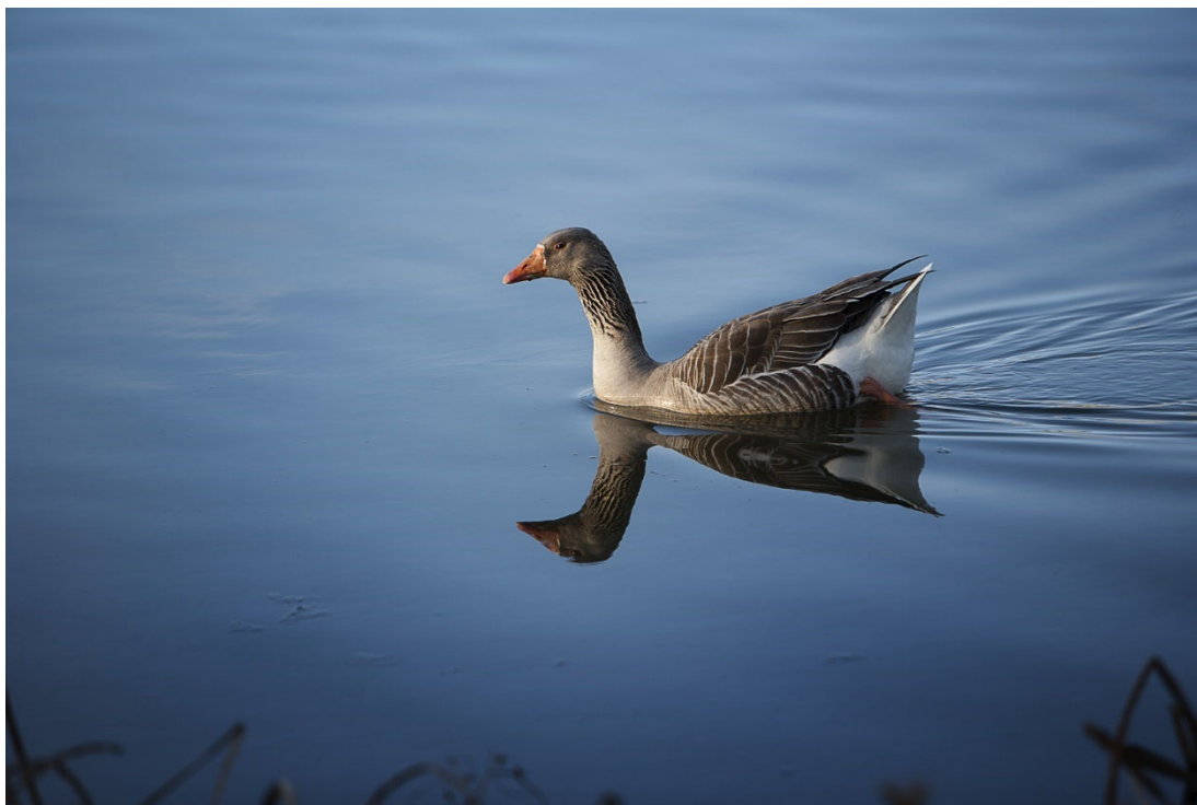
41. Emplumadas de las riberas tormesinas