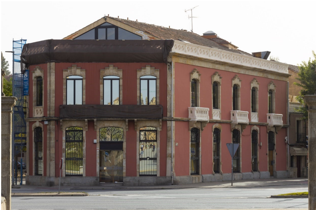
46. Edificio Plaza de Poniente