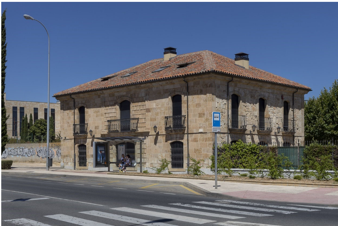
51. Casa del Obispo Lasalle