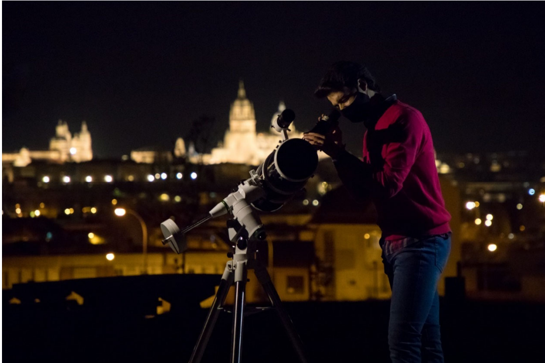
20. Hito visual Parque de Chamberí