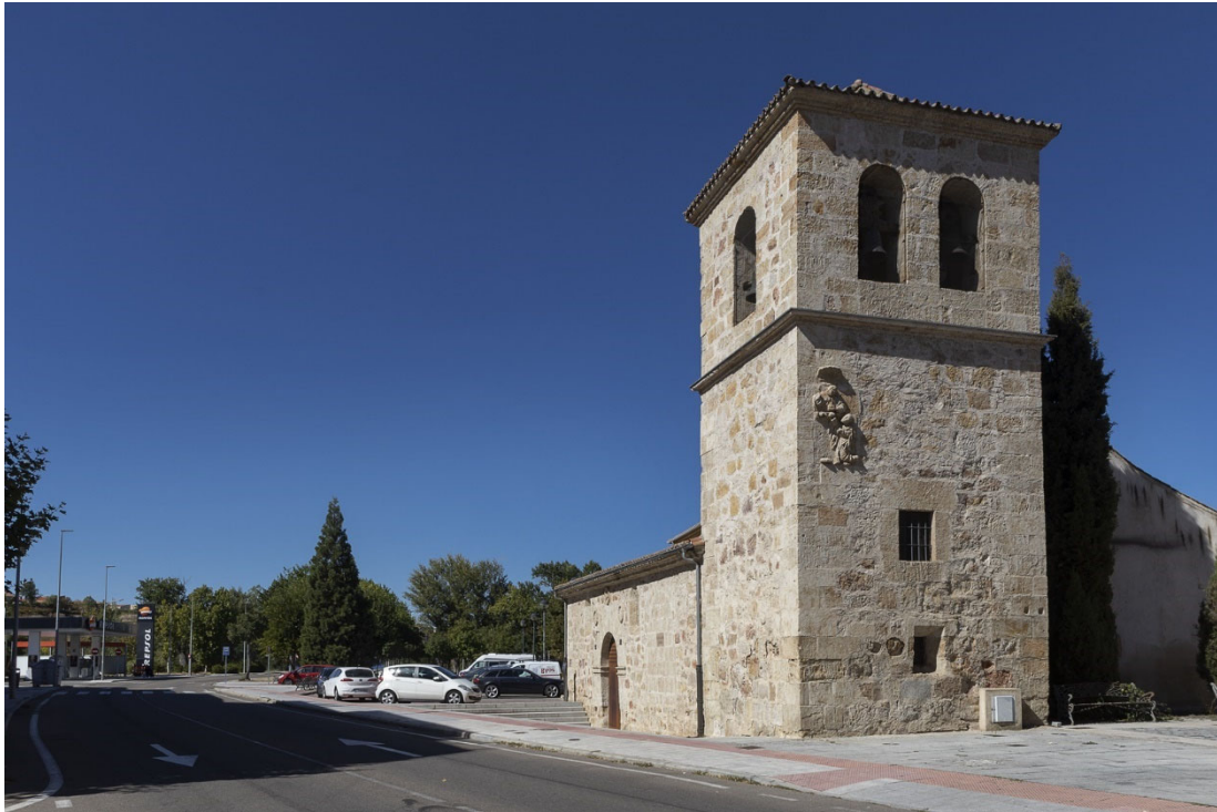
48. Iglesia vieja de la Santísima Trinidad del Arrabal