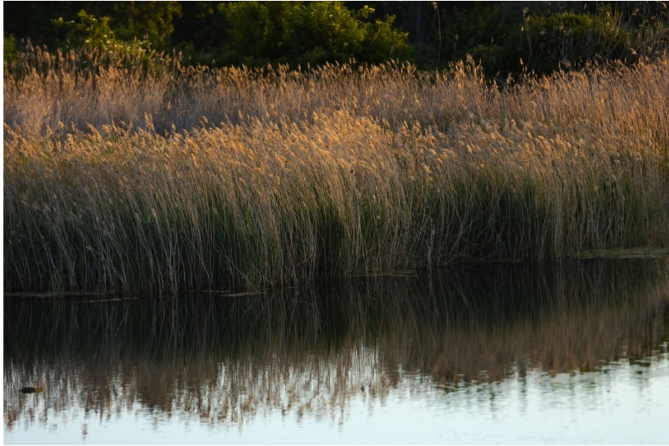
37. Vivir dentro del agua I: especies herbáceas en el agua