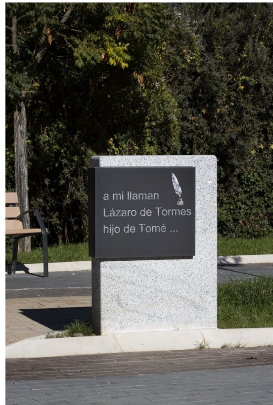
14. Placa obra literaria Lazarillo de Tormes