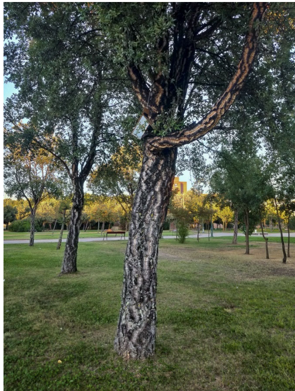
28. Huerta Otea, donde la diversidad se hace jardín