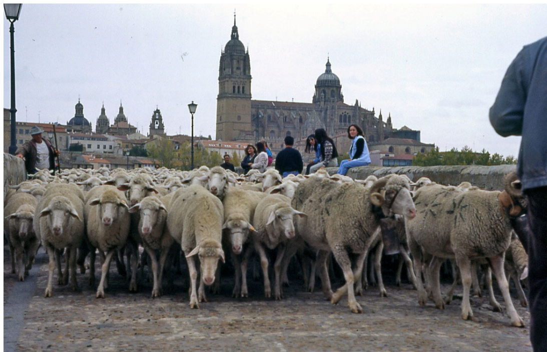
32. Cuando la trashumancia atravesaba la ciudad. Cañada Real de la Plata