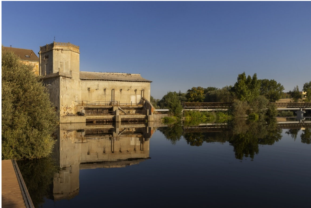
1. Conjunto etnológico pesquera de Tejares