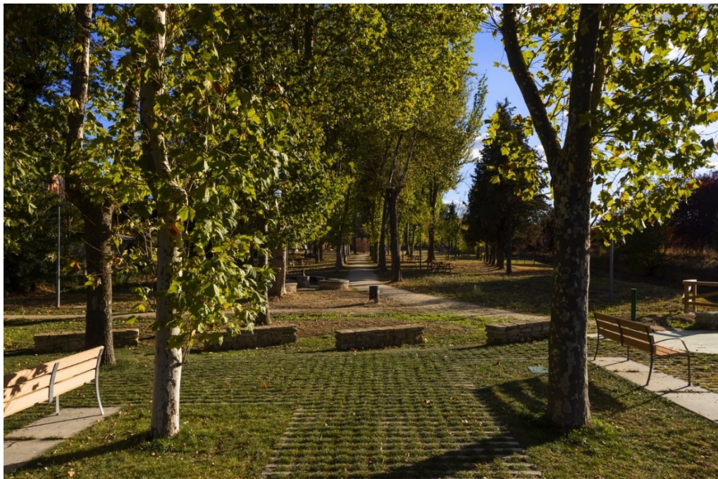
26. Parque del Lazarillo: un punto de fuga arbolado