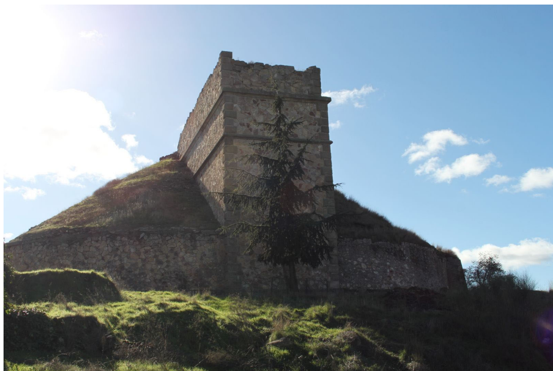
58. Puente de la Salud