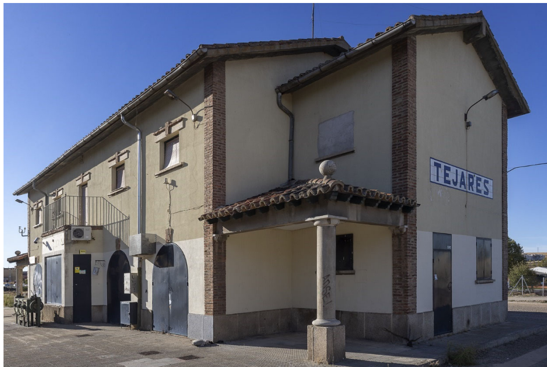
56. Estación de tren de Tejares. Genaro de No