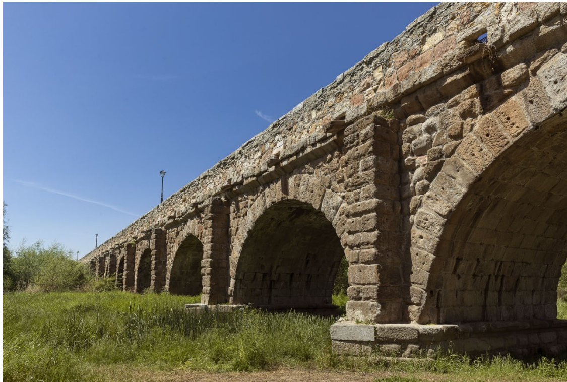
10. Puente romano