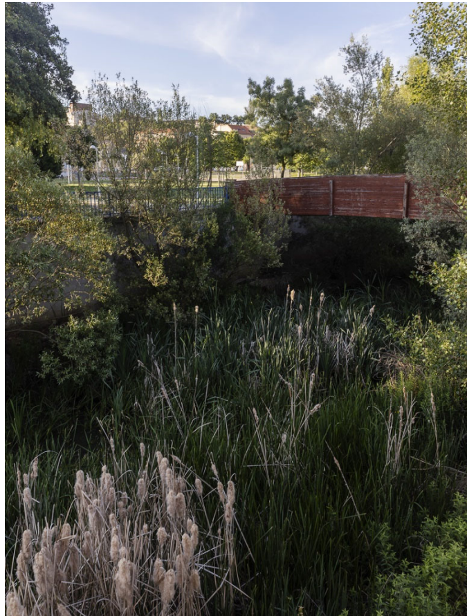
30. Las arterias de agua de la ciudad. El arroyo del Zurguén