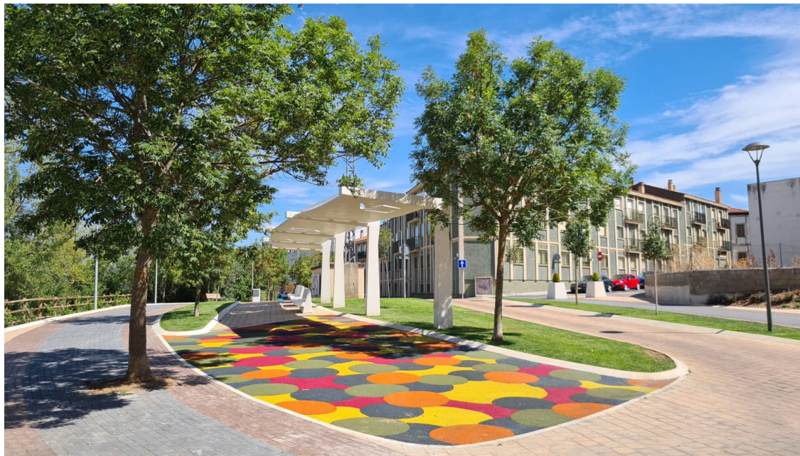
22. El barrio de Tejares