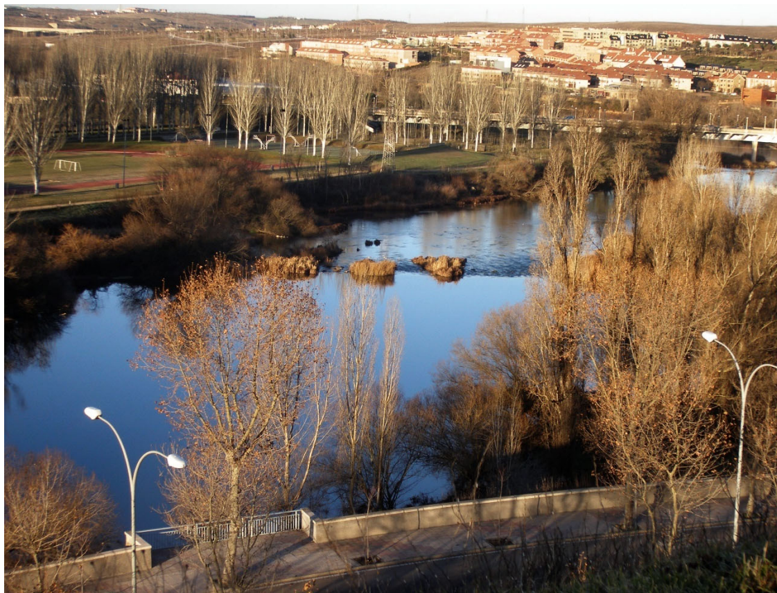
2. La pesquera de Salas Bajas. La construcción oculta