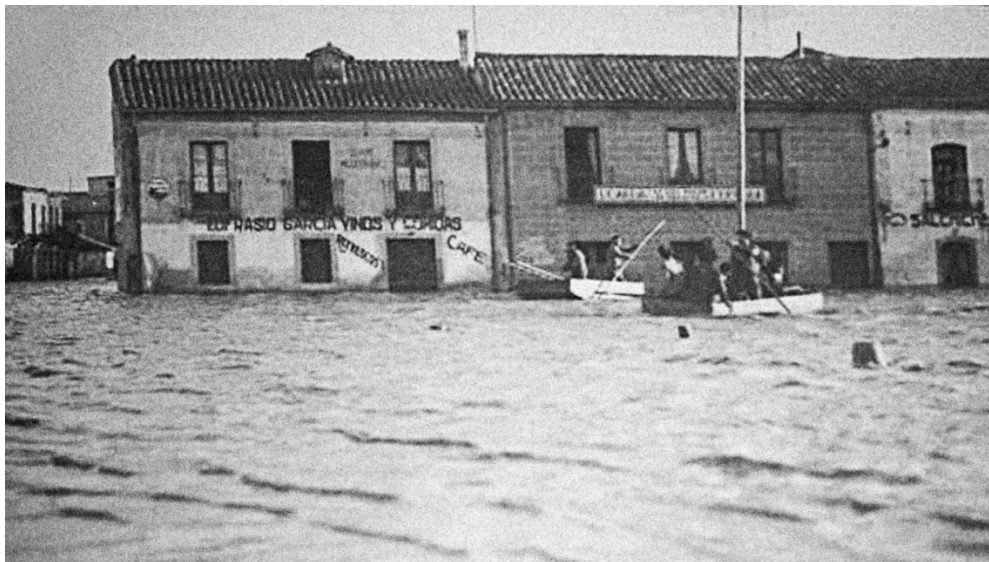
12. Las riadas del Tormes