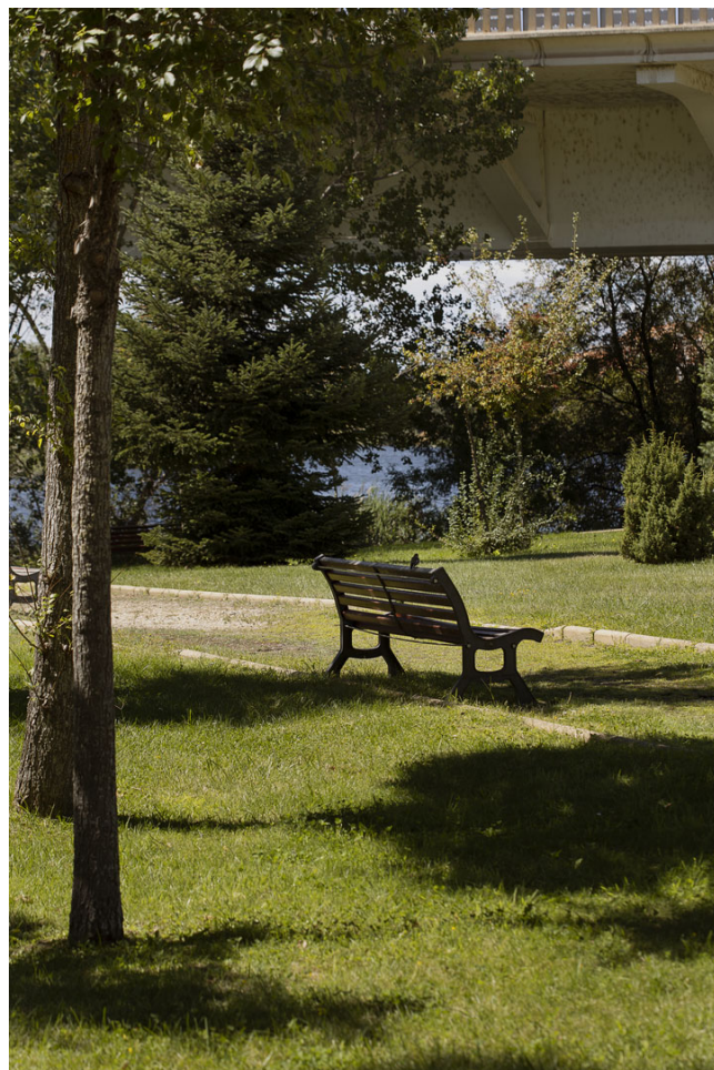
28. Huerta Otea, donde la diversidad se hace jardín