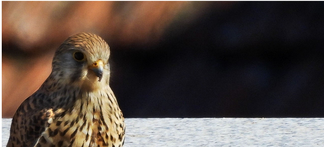
40. “Aves patrimoniales”: convivir con el conjunto histórico