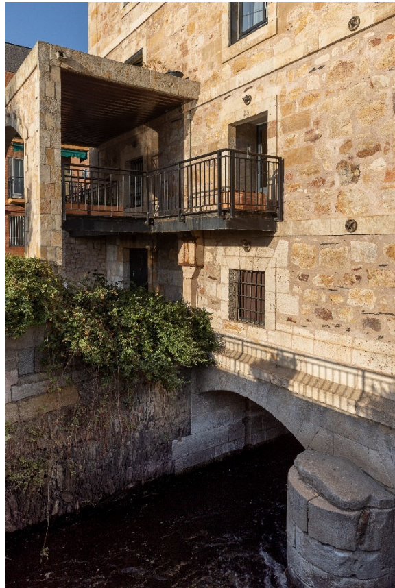
1. Conjunto etnológico pesquera de Tejares