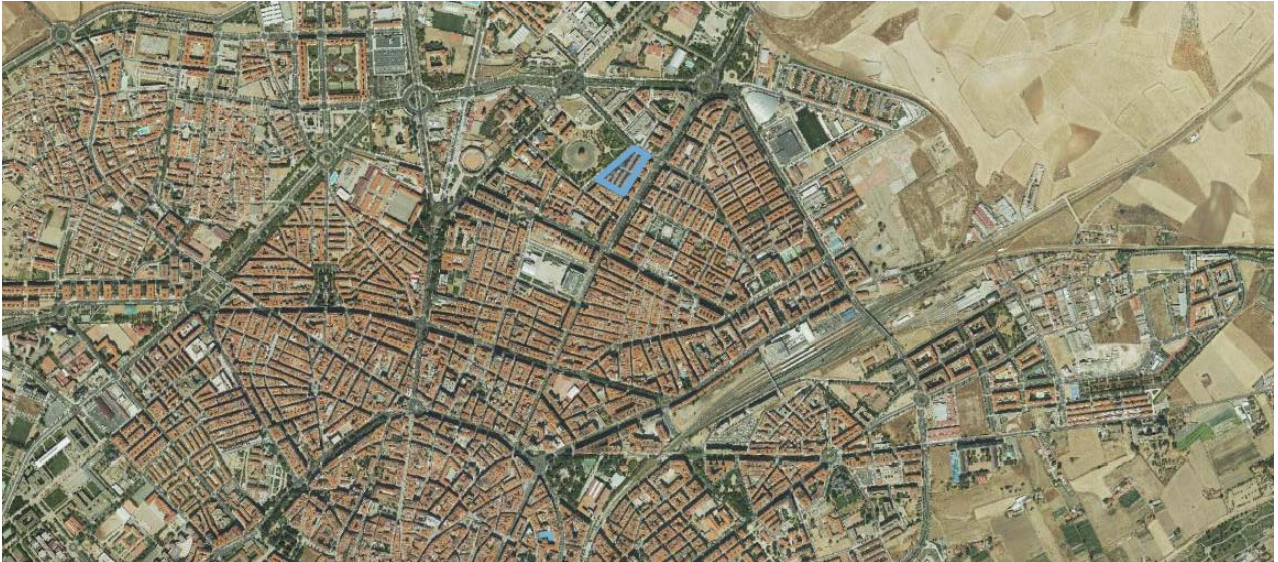
Localización del ERRP en el municipio de Salamanca.