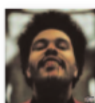
THE WEEKND After hours (2020) Pop / Rhythm & Blues

Blues contemporáneo de profundas raíces, de espíritu punk y funk arrebatador. Fuerza, intensidad y entrega desmesurada en cada una de las piezas, con letras contundentes. Un completísimo álbum merecedor de un Grammy y caracterizado por su gran versatilidad vocal y musical.