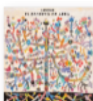
Sidonie El regreso de ABBA (2020) Pop

El disco más variado, completo y ambicioso del trío catalán. También su mejor álbum. Es uno de esos discos (doble) que hace honor a una época que no existe y no sabemos si algún día regresará. La era dorada del pop y el rock en el que se planteaban obras que debían escucharse de principio a fin para ser comprendidas y asimiladas.