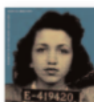
MATANA ROBERTS Coin coin chapter four: Memphis (2019) Jazz

En su segundo álbum en solitario, el ex-líder de One Direction se aleja del territorio rock que conquistó en su debut y se abre camino entre el glam-pop, el indie-folk y el soul. Fine Line tiene varios momentos luminosos y convence con una síntesis actualizada de múltiples géneros.