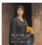
MARA ARANDA Sefarad en el corazón de Turquía (2019) Popular / sefardí

El disco más variado, completo y ambicioso del trío catalán. También su mejor álbum. Es uno de esos discos (doble) que hace honor a una época que no existe y no sabemos si algún día regresará. La era dorada del pop y el rock en el que se planteaban obras que debían escucharse de principio a fin para ser comprendidas y asimiladas.