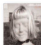
BELAKO Plastic drama (2020) Rock

Quinto trabajo del vallisoletano con los ritmos y timbres de nuestra música tradicional. Hay temas contra la lacra social de la violencia de género, un homenaje a la figura del dulzainero y del redoblante, un recuerdo al oficio del resinero... Y entre todos, no podía faltar un tema que hablase de esta maldita pandemia.