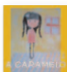
ÁNGEL LÉVID A caramelo (2020) Música popular

En "After Hours" encontramos a un artista que ha vuelto a apostar por los sintetizadores para darle un toque pop años ochenta. Un conjunto sólido de canciones de R&B alternativo que se escucha una y otra vez sin cansarte. Sin duda, el disco del año.