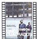
CINCO METROS CUADRADOS (2011) Max Lemcke Cine Español

Alex y Virginia compran un piso. Unos meses antes de la entrega, el edificio está sin terminar. Inesperadamente, precintan la zona y paran las obras. Un año sin soluciones y Álex empieza a tener problemas en el trabajo y con Virginia.