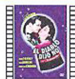
EL DIABLO DIJO NO (1943) E. Lubitsch Comedia

Thriller cerebral en el que cualquier gesto parece quitar una máscara. Quizás lo interesante es que demuestra lo frescas que se mantienen las teorías de Le Carré sobre la necesidad del ser humano de inventarse guerras que no existen para alimentar su miserable espíritu.