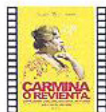
CARMINA O REVIENTA (2012) Paco León Cine Español

Primera versión de la novela de Julio Verne, quien hace gala de su capacidad para adelantarse a los desarrollos científicos y, con su imaginación y sus magníficas descripciones, nos transporta a otro de sus mundos de aventuras.