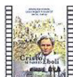
CRISTO SE PARÓ EN ÉBOLI (1979) Francesco Rosi Drama

Esta cálida comedia sigue a una persona atrapada fuera del ciclo interminable de la vida y la muerte. Gracias a una lotería en el mundo celestial, el protagonista es devuelto a la vida en el cuerpo de un joven de catorce años que estaba a punto de suicidarse.