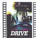
DRIVE (2011) N. Winding Refn Cine negro

Basada en la novela autobiográfica de Carlo Levi, escritor y pintor antifascista condenado al destierro en un remoto pueblecito de Lucania. El título es una metáfora: los medios de transporte se detienen en Éboli, dejando al margen del progreso el resto de Lucania.