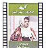
EL ESPEJO (1997) Jafar Panahi Drama

La única película en color de Lubitsch. Su pretexto era la entrevista entre el recepcionista del Más Allá y un recién fallecido, en la que éste evocaba sus méritos para ingresar en el infierno. La mezcla entre fantasía y comedia funciona con admirable precisión.