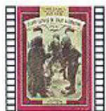
20.000 LEGUAS DE VIAJE SUBMARINO (1916) Stuart Paton Cine Mudo

Alex y Virginia compran un piso. Unos meses antes de la entrega, el edificio está sin terminar. Inesperadamente, precintan la zona y paran las obras. Un año sin soluciones y Álex empieza a tener problemas en el trabajo y con Virginia.