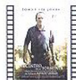
EN EL CENTRO DE LA TORMENTA (2009) B. Tavernier Suspense

Gasland analiza la situación actual de las explotaciones de gas natural en USA. A través de las consecuencias de su producción y consumo, el cineasta repasa especialmente la vida diaria de aquellos que se ven afectados por este tipo de explotaciones, además de analizar su impacto geográfico y local.