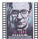
EL TOPO (2011) Tomas Alfredson Suspense

Un crack del volante (Ryan Gosling) reparte su tiempo entre atracos y trabajos como especialista en el cine. El día en que conoce a Irene (Carey Mulligan) su vida da un tumbó más drástico que una de sus piruetas automovilísticas.