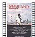
GASLAND (2010) Josh Fox Documental

Mina se pierde por el caótico Teherán cuando decide volver a su casa sola después de esperar que su madre la recoja en el colegio. En el camino, se encontrará con diversos personajes que tratan de ayudarla: un vendedor ambulante, un taxista, un policía y el conductor del autobús. Sus grandes ojos lo diseccionan todo.