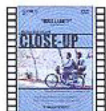
CLOSE-UP (1990) Abbas Kiarostami Drama

Carmina regenta una venta en Sevilla. Tras sufrir varios robos y no encontrar el apoyo de la aseguradora, inventa una manera de sacar a su familia adelante. Mientras espera el desenlace de su plan reflexiona sobre su vida, obra y milagros.