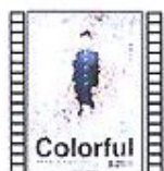
COLORFUL (2011) Keiichi Hara Animación

Un hombre se hace pasar por Mohsen Makhmalbaf, renombrado director de cine. Kiarostami decide investigar el caso del impostor, filma su juicio y a posteriori recrea lo sucedido anteriormente, con la participación de los propios protagonistas de los hechos.