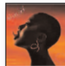
Mélusine (2023) CÉCILE MCLORIN SALVANT Jazz JBS M

La buena y original película está inspirada en "Hamlet". La música tenía que estar en consonancia con el desgarrar personal del protagonista a quien han arrebatado a su padre. Está estructurada en 4 partes. Para amantes de la película y de las bandas sonoras casi en exclusividad.