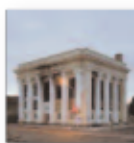
The price of progress (2022) THE HOLD STEADY Rock PR H

El disco no deja indiferente a quien se adentra en sus profundidades. Un sonido fresco, diferente, innovador y a la vez maduro y asentado de quien lleva toda una vida dedicado a la música. Una lírica limpia de significado romántico, y las reflexiones filosóficas y metafísicas nos invitan a que seamos nosotros quienes les pongamos significado y contexto.