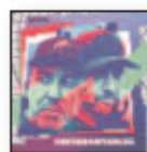
Inkebrantable (2023) SFDK Rap NM S

Delirium Musicum se define artísticamente adoptando una nueva postura en el repertorio audaz y variado que aborda. La famosa orquesta de cámara autodirigida se dedica a ofrecer actuaciones musicales apasionadas y atractivas que conectan profundamente al público con los músicos. ¡Son geniales!