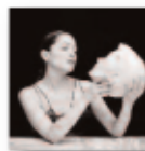
De todas las flores (2022) NATALIA LAFOURCADE Música popular MP L

Séptimo disco en solitario de Tomasito. Se empezó a gestar en 2019 con su primer adelanto 'La Zalamera'. Su producción se vio ralentizada debido a la pandemia y a la frenética actividad de Tomasito en directo por festivales, ferias y chiringuitos. Durante este período de tiempo fue publicando otros adelantos del álbum.