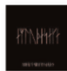
El hombre del norte = The Northman (2022) ROBIN CAROLAN & SEBASTIAN GAINSOROUGH Bandas sonoras BSO N

Un disco sobrio y elegantísimo. Son boleros clásicos salpicados de jazz sinuoso, cuya base es la interpretación, precisa y preciosa, de Natalia, con la dosis exacta de sentimiento. Es un disco largo, pero de singular unidad y cohesión, que se siente como muy bien planificado, pero ejecutado del tirón, en directo, para preservar la sensación de inmediatez y sinceridad.