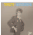
Agustisimísimo (2023) TOMASITO Flamenco FL T

Las canciones de Beach House siempre han sido un viaje en sí mismas. Referentes actuales del dream pop, regresan con un ambicioso disco doble repleto de historias románticas, aprendizajes y viajes temporales. Es ya su 8º álbum y también es una 8ª maravilla, presentando algunas de las mejores canciones de su carrera.