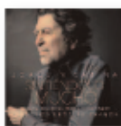
Sintiéndolo mucho (2022) JOAQUÍN SABINA Bandas sonoras BSO S

Las cautivadoras habilidades de Kora de Kadialy se originan en su larga historia familiar de griots. A través de la Kora de 21 cuerdas, recurre a su herencia en busca de inspiración para crear sus propias composiciones. En Senegal, 'Aado' significa 'Costumbres Y Valores Morales'.