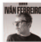
Trinchera pop (2023) IVÁN FERREIRO Pop PR F

Un viaje musical por la película documental de Fernando León de Aranoa, y que sigue los pasos de Sabina durante 13 años en su quehacer musical. Se compone de 27 cortes, entre ellos varios clásicos de José Alfredo Jiménez y un nuevo tema que el maestro de maestros ha escrito junto a Leiva para cerrar la película.