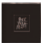
One twice melody (2022) BEACH HOUSE Pop PR B

Un disco doble, los dos lados de una misma moneda, y donde la experimentación destaca, dándonos un abanico amplio de experiencias y sentimientos nuevos, pero siempre manteniendo su tan reconocible sello de identidad. Desde rumbas, hasta cumbias, pasando por technos y flamencos con líneas de bajo distorsionadas. Mucha creatividad.