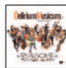
Seasons. Richter-Glass (2023) DELIRIUM MUSICUM, ÉTIENNE GARA Música clásica MC D

La aclamada Cécile McLorin Salvant (ha recibido ya tres premios Grammy consecutivos al Mejor Álbum Vocal de Jazz) saca nuevo disco. Obra inspirada en el cuento medieval del mismo nombre que conjuga cinco composiciones originales con la recreación de nueve piezas tradicionales cantadas en francés, occitano, inglés y criollo haitiano.