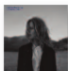
CHRISTINA ROSEVINGE Un hombre rubio (2018) Cantautores

Primer álbum de la nueva estrella del rap. Puede que no sea el álbum debut perfecto, pero está consuetudado a base de potenciar todo aquello que incomoda al público más clasista. Y, gracias a ello, ha lanzado al mercado uno de los discos más pegajosos, divertidos y desenfadados del 2018.