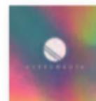
ZAHARA Astronauta (2018) Pop

Un álbum doble que celebra sus 30 años de carrera y un homenaje a todos los artistas que despertaron su pasión hacia la música, especialmente hacia el flamenco. Un disco es de cante flamenco tradicional, y el otro versiones de temas míticos de Bambino, Los Chichos, El Pescaílla, Manzanita o Lole y Manuel entre otros.