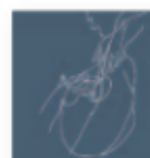
CAMANÉ Camané canta Marceneiro (2017) Fado

Un álbum que reflexiona sobre relaciones paterno-filiales, el machismo, el feminismo y el rol de género en nuestra sociedad. Canciones, más directas, menos crudas, ofrecen todo un abanico de posibilidades, desde el pop más inocente al rock básico y descamado. Un gran disco lleno de detalles, lecturas y texturas.