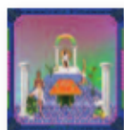
JONATHAN WILSON Rare birds (2018) Pop

El séptimo trabajo de la banda asturiana. Una inteligente, divertida y tierna crónica de la vida de las familias modernas. Hace recorrido por berrinches y perretas, el estrés urbanita, etc. Y todo a ritmo de ska, grunge, e incluso con guiños al trap. Consigue interesar, entretener y enternecer a toda la familia por igual.