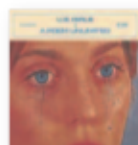
U.S. GIRLS A poem unlimited (2018) Pop

Ha conseguido hacer muy bien algo muy difícil: mantener su esencia pese a un claro cambio de sonido. La poesía de la cotidianidad y las historias casi universales, siguen estando presentes. Es un viaje, una aventura por un universo y de temática variada. La magia de Zahara está tanto en las letras como en las melodías.