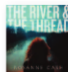
ROSANNE CASH The river & the thread (2014) Country

El pianista Bertrand Chamayou borda la obra de Saint-Saëns porque logra un equilibrio casi perfecto entre las aspiraciones post-románticas del compositor y el personal orientalismo con el que teñía buena parte de sus obras.