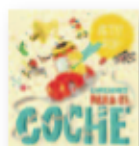
PETIT POP Canciones para el coche (2018) Música infantil

Tras el fantástico debut en 2015 junto a la poderosa banda The Night Sweats, vuelve otro festín de soul rugoso, voces ásperas y vientos exultantes. Las nuevas canciones están menos atadas a sus viejos referentes y suenan frescas y contemporáneas, rebosantes de vitalidad y espíritu libre.