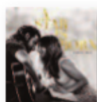
A STAR IS BORN (2018) Banda sonora

El nuevo proyecto de Guille Milkyway tira abajo el muro y coquetea con miles de referencias, actuales y pretéritas, superventas y undergrounds. En el álbum se pueden escuchar sonidos que nos recuerdan a Las Aves, Etienne Daho, Donna Summer, Boy Pablo, The Beach Boys... Y todo ello sin perder un ápice de identidad.