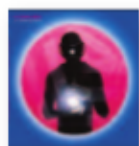
LA CASA AZUL La gran esfera (2018) Pop

El nuevo proyecto de Guille Milkyway tira abajo el muro y coquetea con miles de referencias, actuales y pretéritas, superventas y undergrounds. En el álbum se pueden escuchar sonidos que nos recuerdan a Las Aves, Etienne Daho, Donna Summer, Boy Pablo, The Beach Boys... Y todo ello sin perder un ápice de identidad.