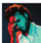
FATHER JOHN MISTY God's favorite customer (2018) Pop

Un título explícito y rotundo para su nuevo álbum, un proyecto que arrancó con su padre. La copla resurge en su voz profunda y sincera. Su obra, siendo pura y ortodoxa, contiene elementos únicos y personales que constituyen una verdadera revolución en el panorama de la tradición flamenca.