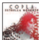
ESTRELLA MORENTE Copla (2019) Música popular

Un título explícito y rotundo para su nuevo álbum, un proyecto que arrancó con su padre. La copla resurge en su voz profunda y sincera. Su obra, siendo pura y ortodoxa, contiene elementos únicos y personales que constituyen una verdadera revolución en el panorama de la tradición flamenca.