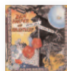
BEN HARPER AND RELENTLESS7 White lies for dark times (2009) Rock

Una banda sonora que huye de las modas actuales para adentrarse en un terreno donde el country pop, el rock y el soul se unen de la mano para hacernos partícipes de la historia de amor de Jackson Maine y una joven Ally que sueña con comerse el mundo. Incluye Shallow, canción ganadora al Premio Oscar 2018.