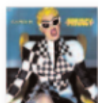
CARDI B Invasion of privacy (2018) Nuevas músicas / Rap

Los 11 temas que componen esta producción tienen ese toque soul característico de Harper, mezclado con un toque de un blues moderno de Texas, lo que hace que sea el álbum más eléctrico que haya publicado. Consiguiendo que tenga toda la emoción de sus conciertos.