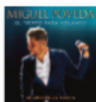
MIGUEL POVEDA El tiempo pasa volando (2019) Flamenco

El disco es su paso definitivo en busca de un estilo más abierto y experimental. Los banjos, mandolinas o steel guitars ocupan una posición secundaria y hay más guitarras acústicas. Su séptimo álbum ha aunado sus raíces musicales tradicionales con el pop sin fisuras, y el resultado no puede ser más sobresaliente.