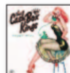
THE CASH BOX KINGS Royal mint (2017) Blues

Father John Misty se mira al espejo y hurga en sus entrañas en busca de un antídoto para la angustia y el vértigo de vivir. El resultado: diez canciones brillantes. Treinta y ocho minutos directos al centro de la diana que, sin renunciar a la ironía, se liberan del cinismo y todo orden conceptual. Un disco magnífico.