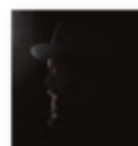
NATHANIEL RATELIFF & THE NIGHT SWEATS Tearing at the seams (2018) Soul

Rocío Márquez propone un ejercicio de memoria. Escuchar memorias vivas y plurales remezclando canciones y cantes, palos y música popular con un nexo difuso pero al mismo tiempo crucial en lo personal: haber sido encontradas en el histórico mercadillo de antigüedades de El Jueves de la calle Feria de Sevilla.