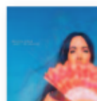
KACEY MUSGRAVES Golden hour (2018) Country / Pop

Una mezcla de estilos basados en el blues cultivado desde sus inicios e incorporado en cada nuevo trabajo. A sus raíces del Delta años 20, Chicago años 40 y 50, jumpin' blues, añaden ahora algo de New Orleans, e incluso toques soul con sección de metales. Contundente y divertido.