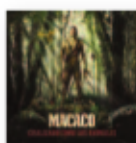
MACACO Civilizado como los animales (2019) Nuevas músicas

Una de las voces más importantes del Fado contemporáneo. Tiene el don innato de ser Fadista. Raquel vive donde vive el Fado, en el corazón de Alfama que late como si fuera el suyo y eso se siente en sus conciertos. Con este álbum ganó los premios Amália Rodrigues y Casa da Imprensa en la categoría revelación.