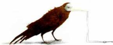
Illustration: Gabriel Fuchs. A las buenas y a las malas. Anaya, 2007

En: III Encuentro de animadores a la lectura. Conferencia Arenas de San Pedro, Junio, 2006.