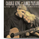
CAROLE KING & JAMES TAYLOR Live at the troubadour (2010) Pop-rock

El flamenco puede contener la alegría, la burla y la chufla para tornarse grave y doliente. Que todos los matices quepan en una sola voz es privilegio de pocos. Ezequiel Benítez lo logra en su segunda grabación, en la que homenajea a los grandes del cante.