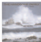
THE HANDSOME FAMILY Singing bones (2003) Country

Un disco repleto de sensaciones, en el que la etiqueta de banda sonora no hace más que ponernos en situación. Un trabajo que captura la sensibilidad de una artista que teje texturas y emociones como nadie. Canciones que se convierten en manifiestos dotados de una humanidad visceral.