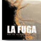
LA FUGA Más de cien amaneceres (2013) Rock

Algunos la acusarán de apuntarse al carro de Lana del Rey, pero la suya es una propuesta más clásica y más centrada en el folk y el country. Tiene su mérito crear unas canciones directas y que suenan frescas haciendo este tipo de música que comparte languidez al tiempo que una estupenda voz.