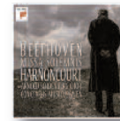
LUDWIG VAN BEETHOVEN Missa solemnis (2016) Clásica

Taylor y King se muestran en plena forma, y la química -musical y emocional- que se establece entre ellos es evidente. Obviamente, el show tiene un inevitable tinte nostálgico, pero las canciones son clásicos que han superado la prueba del tiempo.