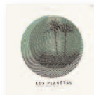
LOS PLANETAS [Zona temporalmente autónoma] (2017) Rock

Iba para nueva estrella del tango argentino, apadrinado por Gustavo Santaolalla y con un vozarrón tremendo, pero hete aquí que sale de Buenos Aires cual viejoven (nació a finales de los 70) al puro campo, a buscar la esencia, la calma del atardecer, la pereza de mirar el cielo... Honestidad brutal.