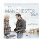
LESLEY BARBER Manchester frente al mar (2016) Banda sonora

El trío británico ha sabido enriquecer su propuesta con un halo de modernidad y frescura que se intuía ya indispensable para que su música no quedase anclada en logros pretéritos. Un disco que lleva al grupo un paso todavía más arriba. Un paso adelante que les sitúa en el olimpo del pop actual.