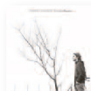
CRISTÓBAL REPETTO Tiempo y silencio (2014) Música popular

Aunque es portuguesa, estudió en Berkeley antes de abrirse camino en Nueva York cantando bossa nova en pequeños locales. Canta sin imitar a nadie y el disco desprende ingenuidad, en el mejor sentido de la expresión, y alegría a partes iguales. Una mezcla jazz, pop, folk, brasil y fado deliciosa.