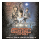
STRANGER THINGS Kyle Dixon (2016) Banda sonora

Siguen siendo únicos. Continúan narrando como nadie esas pequeñas historias escuetamente adornadas y tan bien conducidas, que transitan a ritmo de vals o exprimen el folk menos exprimido, mientras bordean la frontera (la de Texas y la de lo común) o son simplemente interpretadas a capella.