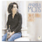
ANDREA MOTIS Emotional dance (2017) Jazz

Tras el magnífico "La vida plena" llega su segundo disco. Encandila o arremete con voz suave, como susurrándonos al oído cuanto le remueve por dentro y le exaspera de fuera. ¿Cantautor de nueva generación? Sí, rotundamente, sí.