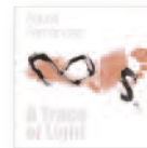
AGUSTÍ FERNÁNDEZ A trace of light (2014) Jazz

Cuando Nikolaus Harnoncourt se retiró de los escenarios, era su deseo expreso publicar la grabación de su último proyecto, la Missa Solemnis de Beethoven, como su legado personal. La más grande obra del genio alemán sirve como testamento artístico del gran experto en Beethoven.