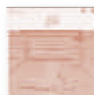
LOS CAMPESINOS! Sick scenes (2017) Pop / rock

Una nueva evolución de la evolución, un acercamiento más estrecho a la estructura de canciones convencionales, pero que no renuncia en absoluto al componente folclórico, crucial en la reinención del grupo.