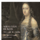
SEBASTIÁN DURÓN Música para dos dinastías / La Grande Chapelle (2016) Música barroca

Nos hallamos ante una de las máximas personalidades de la música española, organista y compositor en la corte de Carlos II y maestro de capilla de Felipe V. El disco incluye varias obras religiosas de Durón en lengua romance, principalmente a ocho voces.