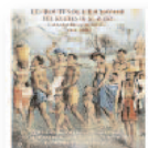
JORDI SAVALL Les routes de l'esclavage = Las rutas de la esclavitud (2017) Clásica / Popular

Nos hallamos ante una de las máximas personalidades de la música española, organista y compositor en la corte de Carlos II y maestro de capilla de Felipe V. El disco incluye varias obras religiosas de Durón en lengua romance, principalmente a ocho voces.