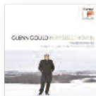
LUDWIG VAN BEETHOVEN Glenn Gould plays Beethoven: piano sonatas (2012) Clásica

L.P. es Laura Pergolizzi y Lost on you ha resultado el espaldarazo definitivo a su carrera. La gran baza de LP son los ganchos pop y, de otra cosa no, pero de ellos el disco sí va bien sobrado, como ha demostrado en su labor de compositora para otras estrellas del pop.