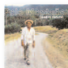
POLO MONTAÑEZ Guajiro natural (2000) Música popular

Cualquier aficionado al estilo, sabrá que Canned Heat fue la banda más grande de "Blues Blanco" que ha habido y habrá, no solo por su capacidad de interpretación, sino por la superioridad frente a otras en adaptar el género y fusionarlo con nuevas tendencias.