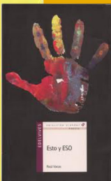
Esto y Eso. — Edelvives, 2010