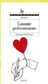
Consumir preferentemente. — Anaya, 2006