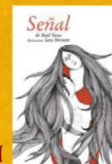
Señal. — MundanaRuido, 2011