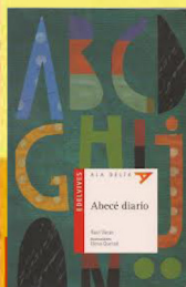
Abecé Diario. — Edelvives, 2012