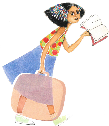
Ilustración de Lucia Sforza en: Lleva un libro en la maleta (Pintar-pintar, 2011)

Da igual si te vas a ir de vacaciones, si te has ido o ya has vuelto, o incluso si no te vas. Sea como sea, en la biblioteca hemos seleccionado una serie de libros donde los protagonistas se van de vacaciones, a la playa, de campamento, al pueblo, al campo... incluso algunos que se quedan en casa, ¿te apetece hacerles compañía? Todos estos personajes están deseando compartir contigo sus aventuras, sus inquietudes, sus vivencias, sus miedos... ¿te apuntas? De todas formas, ¡no te olvides de llevar un libro en la maleta!