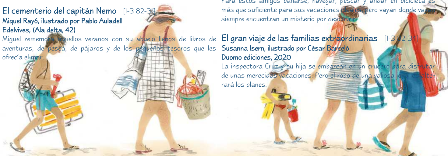
Ilustración de Vessela Nikolova en: En la playa (Patio, 2018)

La inspectora Cruz y su hija se embarcan en un crucero para disfrutar de unas merecidas vacaciones. Pero el robo de una valiosa joya le alterará los planes.