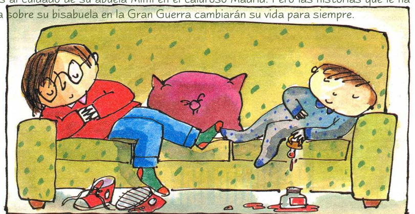
Ilustración de Emilio Urberuaga en: ¡Cómo molo! (Alfaguara, 1997)

Después de un curso perdido lleno de suspensos, Claudia debe quedarse sin vacaciones al cuidado de su abuela Mimi en el caluroso Madrid. Pero las historias que le narra sobre su bisabuela en la Gran Guerra cambiarán su vida para siempre.