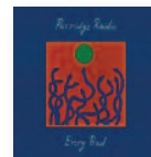
PORRIDGE RADIO Every bad (2020) Rock

Con un equilibrio perfecto, letras con sentido crítico, música sofisticada acorde con los nuevos tiempos y al mismo tiempo relacionada con el r'n'b de los noventa a lo Lauryn Hill y similares, nos brinda un puñado de canciones que brillan con luz propia. El otro elemento que juega a su favor es esa voz maravillosa que se ha comparado a la de Amy Winehouse.