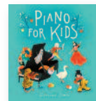
CORINNA SIMON Piano for kids (2019) Música infantil

El grupo de origen vallisoletano-californiano nos acerca la oportunidad de escuchar el folk más contemporáneo y cosmopolita, con grupos que apuestan por las nuevas tendencias del folk. Aúnan temas propios, versiones de canciones castellanas y alguna que otra "joya" de la tradición escocesa con un sonido contemporáneo