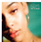
JORJA SMITH Lost & Found (2018) Soul

Mills pinta paisajes sonoros manipulados convirtiendo lo mundano en excepcional. "Mutable Set" no es solo un disco de música, sino que es una experiencia cártica, inmersiva y atemporal en la que los instrumentos se toman su tiempo para aparecer y en la que Blake más que cantar te susurra al oído.