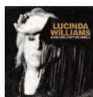
LUCINDA WILLIAMS Good souls better angels (2020) Rock

Lady Gaga vuelve a enfocar sus miras hacia la pista de baile, hacia la exuberancia y el artificio. Su nuevo trabajo se sostiene sobre un concepto futurista y alienígena. Un excelente revival de la música house grandiosamente producido. Chromatica genera muchísimas ganas de bailar de nuevo y liberar energía.