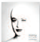
SILVIA PÉREZ CRUZ Farsa (2020) Cantautores

La ensalzada artista catalana recorre sus geografías musicales predilectas en su trabajo más genuino y menos complaciente. Silvia es una artista muy singular y Farsa procura ser un trabajo concebido en primerísima persona. Propone reflexionar sobre el valor de lo consustancial frente a la inanidad de las apariencias.