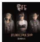
ATLANTIC FOLK TRIO Adventure (2019) Música popular