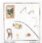
BLAKE MILLS Mutable set (2020) Música rock

Corinna Simon consigue el reto de hacer más accesible a los niños la música de piano. El álbum tiene como objetivo despertar la curiosidad de los jóvenes oyentes y tentarlos fuera de los caminos trillados. La grabación constituye una experiencia agradable y fácil de escuchar, tanto para niños como para los mayores interesados en el instrumento.