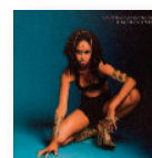
LES AMAZONES D'AFRIQUE Amazones power (2019) Música popular

La hija de Miller Williams es desde hace años la reina del folk-rock americano. Guitarras, guitarras y más guitarras es lo primero que te viene a la cabeza en las primeras escuchas. Y es que Lucinda Williams nos ofrece su trabajo más rockero y potente de toda su carrera. Un disco bluesero y oscuro de corazón denso.