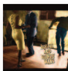
BOB DYLAN Rough and rowdy ways (2020) Cantautores

El guitarrista Tom Misch, asentado en el R&B y el funk, y el baterista de jazz Yussef Dayes se entienden a la perfección y han terminado creando una especie de jam session de doce temas hechos con calma y reposo, con una producción minuciosa muy sólida a nivel artístico. Dos almas artísticas inquietas, en permanente evolución.