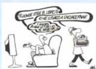
Un dibujo con texto

Si te animas, acércate al mostrador de la sección infantil y allí te darán una hoja para presentar tu chiste. Puedes presentar todos los que quieras hasta el 31 de octubre de 2009 .