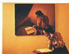
SEGUNDO PREMIO Blanca Morales Prado "En compañía"