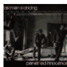
Lastmen Standing Perverted innocence (2015) Pop-Rock

Tras el éxito de su primer disco ("California", 2012), esta banda de Folk-Rock independiente acaba de lanzar su segundo álbum de estudio, "Origen". Un trabajo fresco, directo y potente que sigue prestando mucha atención a las originales melodías y arreglos que caracterizan a esta formación. En él queda clara constancia de sus influencias más rockeras.