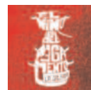
El Niño del Pegamento La Galería (2015) Pop-Rock

-SHE-, dedicado a la Virgen María, les ha llevado mucho más tiempo tanto en la composición como en la elaboración y los arreglos.