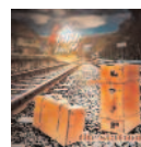
The Crazy Band The station (2015) Pop-Rock

Es el primero de larga duración que sacan bajo un sello y, de la mano de Carníbal Producciones, por fin llegan al formato digital.