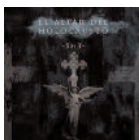
El Altar del Holocausto -SHE- (2015) Pop-Rock

El proyecto musical "Palabras desnudas" incluye notas folk y blues americano o lo que ellos denominan "Música de los Pantanos". Ellos mismos se definen así: "El Hombre Tranquilo es rock en estado puro. Las canciones de amor que nunca pasan de moda son nuestras preferidas. Llevamos toda la vida buscando la canción perfecta con los mejores músicos y hoy, seguimos en ello".