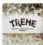
TREME (2010) Banda sonora