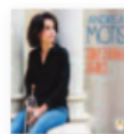
ANDREA MOTIS Emotional dance (2017) Jazz

Suena a Vetusta Morla, obviamente, pero la riqueza en los arreglos, el preciosismo en la producción, la cantidad de texturas en cada tema y la evidente búsqueda del riesgo y el inconformismo nos muestran a una banda que abre con este disco una nueva fase en la que multiplican por mil todos sus puntos fuertes.