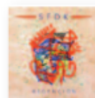
SFDK Redención (2018) Rap

Un álbum de consenso, una versión pulida y actualizada de sus dos anteriores trabajos. Irradiando inocencia y normalidad, el músico ha logrado dar con la fórmula perfecta para que sus canciones sean escuchadas en cualquier ocasión. Un disco de récord que amplía su base de seguidores.