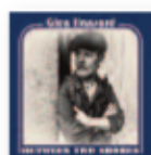
GLEN HANSARD Between two shores (2018) Pop-rock

Kinga Glyk toca un instrumento que pocas mujeres tocan: el bajo. Acompañada por tres estrellas del jazz, la joven polaca nos subyuga con una obra en la que su técnica impresionante está al servicio de un ritmo muy inspirado. Siete canciones originales más la reinterpretación de "Teen Town" y la viral "Tears in Heaven".