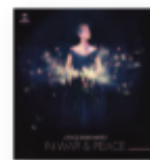
JOYCE DIDONATO In war & peace: Harmony through music (2017) Ópera

Este polifacético y original gaditano (cantante, saxofonista, compositor) experimenta en Oriente con ritmos y sonidos del Este, los cuales encajan como un guante en la fusión de los condimentos esenciales del cantaor: el flamenco y el jazz. Talento y emoción se unen en un artista que cada vez es más reconocido.