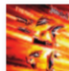
JUDAS PRIEST Firepower (2018) Heavy metal

El disco evoca con fuerza melodramática el folclore de lucha y supervivencia en América, siente los ecos de lamento desde el pantano al campo de algodón, pero transmite el calor de una hoguera en mitad de la ventisca, reconforta y da refugio. Segunda colaboración del dúo tras su exitoso Get up .