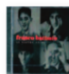
FRANCO BATTIATO Le nostre anime (2015) Cantautores

“Caravana” cuenta el trayecto que hicieron los gitanos de Oriente a Occidente, la historia de una tribu del norte de la India que emigró recorriendo la antigua Persia y Turquía. De ahí que este álbum tenga mil colores. Rock flamenco empapado por la psicodelia que une a Triana con Tame Impala.