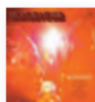
SHARON JONES & THE DAP-KINGS Soul of a woman (2017) Jazz