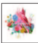
VETUSTA MORLA Mismo sitio, distinto lugar (2017) Pop / Rock

Hablando claro, un disco del verso libre del pop español. La Bien Querida se ha atrevido a dejar su zona de confort más bien popera – siempre con el trasfondo del flamenco, por supuesto – y se ha atrevido a tantear en otros terrenos. Cuenta con las colaboraciones de Jota (Los Planetas) y Muchachito.