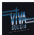
VIVA SUECIA Otros principios fundamentales (2017) Pop / Rock

Uno de sus discos recientes más inspirados y, probablemente, el más rotundo desde "Painkiller". El nuevo álbum de Judas Priest es básica y fundamentalmente el disco que los fans heavymetaleros de la formación británica más de la época de la década de los 80 estaban esperando desde hacía bastantes años.