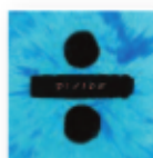
ED SHEERAN Divide (2017) Pop

Viva Suecia se postulan como el lado menos amable del rock alternativo popular, sin dejar de encajar en dichos parámetros. Cubren la visceralidad que otros no desean explorar, no temen al ruido ni a provocar vértigo. El crecimiento desde "La fuerza mayor" (2016) es descomunal y sorprendente.