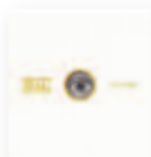
IZAL Autoterapia (2018) Pop

En su tercer disco en solitario, resuenan más que nunca la Santísima Trinidad que sonaba en su casa de pequeño: Dylan, Cohen y Van Morrison. Un equilibrio entre los dos instintos del músico, la vertiente de irlandés salvaje que invita a la fiesta y la del hombre sensible que busca entenderse a través de canciones.