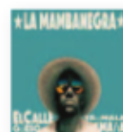
LA MAMBANEGRA El Callegüeso y su Malamaña (2017) Música popular

Aquello que casi nadie entendió, la muerte de Deluxe y la colosal tarea de sumar la herencia pop-rock de la extinta banda con la influencia de los viajes –los de Xael López– por Latinoamérica, cumple ya tres álbumes. Y treinta y cinco canciones después, sólo hay una conclusión posible: el sacrificio mereció la pena.