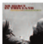
BEN HARPER AND CHARLIE MUSSELWHITE No mercy in this land (2018) Blues

La música es un plato fuerte en la película 'Baby Driver' y lo han sabido aprovechar muy bien. Entre las 30 canciones se incluyen joyas de todos los géneros musicales pertenecientes a varias décadas, desde The Beach Boys a Queen, pasando por Beck, Barry White, T. Rex y Blur. El director ha demostrado ser tan buen cinéfilo como melómano.