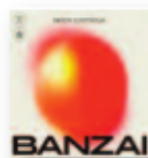
GATA CATTANA Banzai (2017) Nuevas músicas

La Mambanegra es una poderosa orquesta colombiana que trae un nuevo concepto de la salsa y la música latina para el mundo. Su veneno tiene como sustancia la salsa neoyorkina de los años 70s y a su vez integra elementos de la música jamaicana, el funk y el hip-hop. El primer disco ha obtenido excelentes críticas.