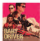
BABY DRIVER (2017) Banda sonora

Una mirada más pausada y analítica, despojada de mucho tópico, entre la reflexión, la autocrítica y la melancolía, marca de inicio a fin Lebron , el nuevo disco del MC sevillano ToteKing. Centrado, lúcido, desacomplejado y muchísimo menos autocomplaciente, el rapero firma sus mejores letras de los últimos años.