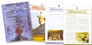
Guías Bibliográficas "Biblioteca"