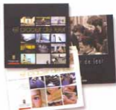
Bases y catálogos "Placer de leer"