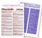
Boletines sección local novedades