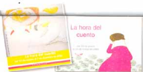
"La hora del cuento"