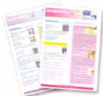
Boletines novedades infantil