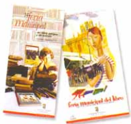
Programas Ferias del libro