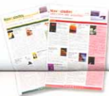
Boletines novedades adultos