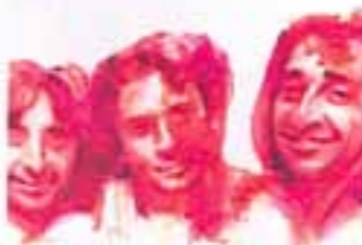
ketama de aki a ketama