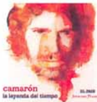
camarón la leyenda del tiempo