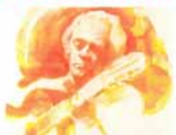
manolo sanlúcar tauromagia