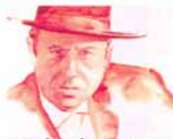
antonio mairena cantes de cádiz y los puertos

Un trabajo antológico que recoge las principales líneas cantaores de Triana, Cádiz y los Puertos. Acompaña la guitarra de Melchor de Marchena y debuta con Mairena, Enrique de Melchor. Antonio Mairena es el eslabón que enlaza los grandes cantaores del pasado con los que forman nuestro espléndido presente. Cantaor extraordinario, su labor investigadora del flamenco fue trascendental, y este es un rasgo que le distingue fundamentalmente del común de los cantaores.