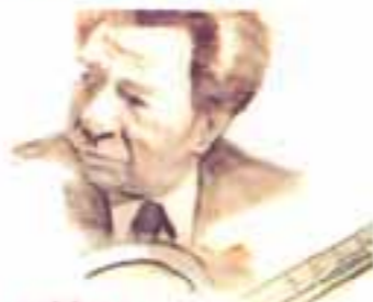
sabicas la guitarra de sabicas