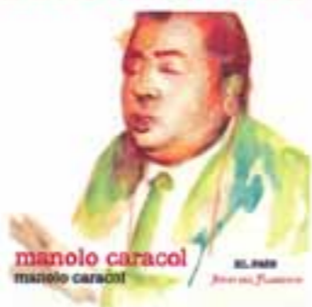
manolo caracol manolo caracol