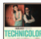
MARLANGO Technicolor (2018) Jazz

Un quinto álbum que reafirma el gran nivel del grupo, teniendo un estilo desenvuelto, que despliega complejidad y abre un abanico de varias facetas donde bailan a su son y lo recrean en un sobresaliente trabajo. Alquimia sonora capaz de crear un equilibrio musical perfecto.