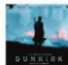
DUNKERQUE BSO Hans Zimmer (2017) Bandas sonoras

Un disco artesanal que es una película a través de la música. Sus escenas son canciones que suenan a blanco y negro, a gánster, a humo, a bar con piano. La elaboración de esta estética es un esfuerzo consciente de recrear una época que Leonor Watling y Alejandro Pelayo admiran.