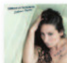
ROSARIO LA TREMENDITA Delirium Tremens (2017) Flamenco

El onubense se ha aliado con las Nuevas Voces Búlgaras para liderar un proyecto de mestizaje donde dialoga con Camarón, Morente y Lorca, a los que considera intérpretes libres y valientes en el flamenco. Un disco que se revela tan exótico como flamenco.