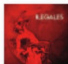
ILEGALES Rebelión (2018) Pop rock

Su undécimo álbum es una bofetada de realidad. Concebido en esa dualidad paradójica (felicidad/tristeza), que nos da la vida, es posiblemente uno de los más comprometidos de su trayectoria. Clarividencia inconformista, rebeldía desahogada y provocación infatigable.