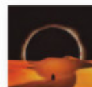
TOUNDRÁ Vortex (2018) Pop rock

Ha llegado para cambiar el estado de cosas. La vocación de obra para la masa no resta un ápice del arte original de la catalana. El disco es un compendio de pop barroco y flamenco alucinado que presenta un hilo que hilvana una tragedia, un concepto desarrollado impecablemente.