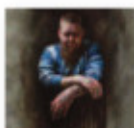
RAG 'N' BONE MAN Human (2017) Pop / rock