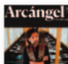
ARCÁNGEL Al este del cante (2018) Flamenco

Su undécimo álbum es una bofetada de realidad. Concebido en esa dualidad paradójica (felicidad/tristeza), que nos da la vida, es posiblemente uno de los más comprometidos de su trayectoria. Clarividencia inconformista, rebeldía desahogada y provocación infatigable.