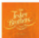
THE TESKEY BROTHERS Half Mile Harvest (2018) R&B / Soul

El disco rescata siete temas -dos inéditos- grabados en 1963 por el saxofonista y su cuarteto estelar. Impecablemente grabado, muestra a la banda en plena madurez y a Coltrane como un músico en sólido ejercicio de sus capacidades superlativas, en tanto líder, intérprete y compositor.