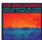
THE NEW RAEMON Una canción de cuna entre tempestades (2018) Pop / rock

Gran disco debut de los australianos. Un dulce disco de soul y Rhythm & Blues sureño que se grabó en analógico y directo para captar la calidez y magia del momento, con ese maravilloso tono vocal de Josh Teskey, rico y relajante, con sabores de blues que se filtran por todo el disco.