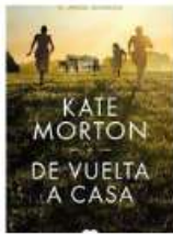
De vuelta a casa Kate Morton SUMA N MOR dev

Nochebuena de 1959, Altos de Adelaida, Australia. Al final de un día caluroso, junto a un arroyo en los terrenos de la mansión de la familia Turner, un repartidor realiza un descubrimiento espeluznante. Comienza una investigación policial y el pequeño pueblo de Tambilla se ve inmerso en uno de los casos de asesinato más desconcertantes y dolorosos de la historia de Australia del Sur. Sesenta años más tarde Jess ha perdido su empleo en el periódico y tiene dificultades para llegar a fin de mes. Inmersa en encontrar una buena historia que cambie su suerte, recibe una llamada inesperada por la que decide abandonar Londres y regresar a Sidney. Su abuela Nora, con quien se crio, ha sufrido una caída y está ingresada. El recuerdo de su querida abuela contrasta con la realidad al encontrar a una mujer frágil y desconcertada. De vuelta a casa es el regreso de voces de la Kate Morton en la que explora el poder de la maternidad, la erosión que provocan los recuerdos guardados durante generaciones y el poder curativo de la verdad.