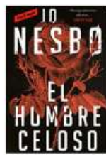
El hombre celoso Jo Nesbo Penguin Random House N NES hom

Nosotros es una novela que explora los límites del sentimiento amoroso y a su vez un viaje a las profundidades del alma de una mujer atrapada en una utopía íntima, imaginativa y mortal. Sin embargo, poco a poco iremos descubriendo que la soledad impone su ley y su desgarrar.