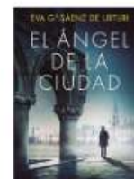
El ángel de la ciudad Eva G a Sáenz de Urturi Planeta N CAR ang

La autora de la exitosa trilogía de Ana Arén, regresa con su más sorprendente novela. Tras un inicio impactante, el lector se ve rápidamente enganchado en una trama que no le dará tregua. Una calurosa noche de verano, diez personas se arrojan al vacío desde las habitaciones de la séptima planta de un mismo hotel en Madrid. Ninguna de ellas se habían registrado en recepción, ninguna de ellas lleva nada que le identifique, y a simple vista, constituyen un grupo humano de lo más heterogéneo. De la mano de Santiago Munárriz, un peculiar y carismático miembro del Instituto Anatómico Forense, el lector irá descubriendo qué hechos y motivaciones se esconden tras este sorprendente y desconcertante suceso.