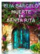
Muerte en Santa Rita Elia Barceló Roca N BAR mue

En «Historia de una trenza» conoceremos la historia de David, Lilly y Alice, de sus padres, de sus descendientes, de sus antepasados, de la casa donde han vivido durante mucho tiempo, de aquellos objetos importantes en sus vidas y un sinfín de cosas más. Una novela que arranca en 2010 cuando Serena y James regresan a Baltimore desde Filadelfia, donde ella ha ido a conocer a los padres de él. En ese viaje de vuelta Serena echa un vistazo atrás a su familia y se hace a la idea del concepto de familia tan diferente que tienen una y otra. «Historia de una trenza» reflexiona acerca de los momentos que conforman una vida de forma tierna, divertida, precisa, sublime y también arrolladora porque la vida tiene un poco de todo y Anne Tyler recurre a este tema y lo explota de forma maravillosa.