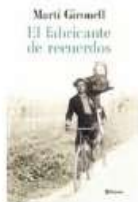
El fabricante de recuerdos Martí Gironell Planeta N GIR fab

El fabricante de recuerdos narra las peripecias del maravilloso viaje del fotógrafo ambulante Valentí Fargnoli, que a principios del S. XX recorre el país retratando su gente y costumbres en el momento en que las fotografías empiezan a formar parte de la vida de las personas, capturando instantes irrepitibles y atesorando recuerdos.