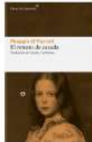
Retrato de una mujer casada Maggie O'Farrel Lumen N FAR ret

Invierno de 1808-1809. El ejército británico al mando de sir John Moore es enviado a ayudar a la causa española durante la Guerra de la Independencia, pero al poco tiempo se verá obligado a replegarse a la ciudad de A Coruña perseguido por las fuerzas de Napoleón. La irlandesa Catherine Gallagher, esposa de un soldado de infantería, nos cuenta desde dentro cómo fue el día a día de esa trágica retirada por tierras de Zamora, León y Galicia en un invierno especialmente duro e inclemente. Va a tratar la guerra desde el punto de vista de aquellos que más la sufren sin ser sus protagonistas: las mujeres acompañando a sus maridos a la guerra. Porque se trataba de eso, de esposas, no de prostitutas que con permiso de los mandos (y previo sorteo, porque no podían ir todas) acompañaban a sus maridos a la guerra, que no a la batalla.