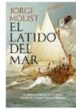
El latido del mar Jorge Molist Planeta N MOL lat

Es a través de los ojos de Bruno ojos que Donato Carrisi nos va descubriendo un mundo oscuro, cruel e inquietante donde somos testigos de las inquietudes más trágicas y turbias de algunos seres humanos