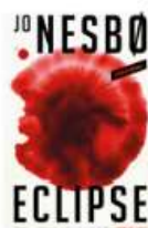
Eclipse Jo Nesbø Penguin Random House N NES ecl

Una emocionante y poética novela, que nos habla de resistencias, con el mar como hilo conductor de la trama, sobre el drama de los refugiados en el Mediterráneo y el fracaso de una vida global que al final no hace más que empobrecer a los mismos de siempre. La historia de "Piel de deriva" es la de ese Mediterráneo al que no queremos mirar; no el de la playita y el chiringuito sino el de las farsas geoestratégicas y la aparición constante de pateras cargadas más allá de lo concebible con personas desesperadas.