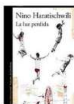
La luz perdida Nino Haratischwili Alfaguara N HAR luz

Una historia que trata sobre la dificultad de entendimiento entre generaciones. Javier y Celia son padres de una familia media de Madrid cuya vida cambia por un incidente desastroso en un viaje a los Pirineos. A partir de ahí nos muestran la dificultad del paso de la infancia a la adolescencia de su hija Inés, el aislamiento en un cuarto cerrado en el que es imposible entrar.