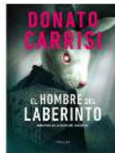
El hombre del laberinto Donato Carrisi Duomo N CAS cuc

Jo Nesbø, creador del popular detective Harry Hole, regresa con una colección de relatos en los que están muchas de las claves que le han convertido en uno de los nombres fundamentales del género negro contemporáneo: doce historias (algunas de extensión más próxima a la novela corta que al relato) en las que el noruego ofrece una muestra más de su talento para poner al descubierto los rincones más oscuros del ser humano y para crear personajes de no menos tenebrosas convicciones, arrastrados por emociones fuertes y envueltos en tramas llenas de suspense, giros inesperados que hace que varios de estos relatos nos recuerden a los cuentos macabros de Edgar Allan Poe o Roald Dahl, mezclados con elementos fantásticos e incluso, escenarios apocalípticos.