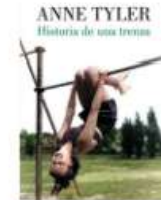
Historia de una trenza Anne Tyler Lumen N TYL his

El retrato de casada nos coloca del lado que habitualmente queda en las sombras, para hablarnos de la vida y la muerte de Lucrezia De Medici. Una nota a modo de prólogo nos pone en situación: en 1561 y en circunstancias extrañas, Lucrezia moría apenas un año después de haber contraído matrimonio con Alfonso II del Este. Dieciséis años tenía. Con semejante bomba informativa arranca un libro que se dedica a rellenar los huecos que no sabemos de la vida de la joven, desde sus orígenes como hija algo más asilvestrada que sus múltiples hermanos y hermanas, hasta su prematura muerte. El retrato de casada es una lectura en la que sistemáticamente se le cortan las alas a su protagonista principal y también al lector, que quiere desplegarlas con ella y echar a volar.