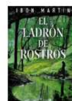
El ladrón de rostros Ibón Martín Plaza & Janés N MAR lad

Venecia es una ciudad misteriosa y atípica, llena de canales, fábulas, detalles y, sobre todo, de arte. Por eso esta ciudad se convierte en el escenario ideal para el regreso de Unai López, Kraken, el icónico personaje de Eva G a Sáenz de Urturi que en cada entrega, y ésta es ya la quinta, nos va descubriendo su pasado familiar y su peculiar relación con el mundo artístico y de la bibliofilia. Una novela de dualidades, narrada a dos voces y que nos adentra en dos época diferentes, para recordarnos que el pasado siempre vuelve.