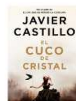
El cuco de cristal Javier del Castillo SUMA N CAS cuc

Tercera entrega de la saga negra ambientada en Galicia. Una intriga donde se encadenan varias muertes y nadie está libre de peligro ni de sospecha. Los inspectores Abad y Barroso, bajo las órdenes del comisario Álex Veiga, vuelven a escena para resolver un caso que requiere indagar en el pasado, en busca de las piezas faltantes en el puzle del suicidio de Antía Morgade y, ante todo, no dejarse llevar por las pistas engañosas ni la camaradería, que puede encubrir oscuras intenciones.