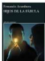
Hijos de la fábula Fernando Aramburu Tusquets N ARA hij

Fernando Aramburu vuelve a reflexionar sobre el sufrimiento que el mundo del terrorismo ha causado durante décadas en el País Vasco, asumiendo, además, todo un reto ético y estético. En esta ocasión, se aleja del simbolismo, de la dureza, de la soledad de sus obras las obras anteriores que trataban este tema como "Los peces de la amargura", "Años lentos" o "Patria" para cambiar el tono y acercarse al tema desde un enfoque diferente: jocoso, esperpéntico, a ratos con toques de vodevil y de novela picaresca para narrarnos las peripecias de Asier y Joseba, dos jóvenes que sen van al sur de Francia para convertirse en militantes de ETA.