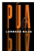
Púa Lorenzo Silva Destino N SIL pua

La voz sincera, personal y dulce de Inma Chacón, nos regala en su nueva novela un canto de amor a la familia, un libro muy personal en el que nos narra su propia historia familiar, que escribió para su madre cuando ésta ya era muy mayor, una mujer que se quedó viuda muy joven con 9 hijos con los que se trasladó a Madrid para poderles dar una educación y un futuro. El cuarto de la plancha es un reconocimiento y homenaje a esta mujer valiente y siempre esperanzada, pero en realidad, a todas las madres de una época. El lector viaja a la infancia de la autora pero también a los recuerdos personales de nuestras propias vidas, siendo al final una narración certera de una época y unas mujeres que han marcado a varias generaciones.