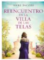
Reencuentro en la Villa de las Telas Anne Jacobs Plaza & Janés N JAC ree

La Villa de las Telas cierra sus puertas. Concluye la saga histórica y romántica con tintes de drama Augsburgo, 1939. La familia Melzer se enfrenta a tiempos oscuros. La Segunda Guerra Mundial va a cambiar las vidas de todos para siempre. La fábrica de telas está al borde de la bancarrota y Paul de nuevo tiene que tomar una dura decisión, esta vez sin su esposa, Marie, que desde 1935 vive con su hijo Leo en Nueva York. Los años de ausencia han causado en ella una profunda tristeza, aunque su amor por Paul es más fuerte que nunca. Y cuando Marie oye hablar de que hay una nueva mujer en la vida de Paul su mundo se tambalea. ¿Conseguirá recuperar a su amado marido?