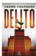
Delito Carmen Chaparro Espasa N CHA del

La nueva novela de Lorenzo Silva nos presenta y regala un nuevo personaje, un extraordinario personaje, complejo y lleno de claroscuros, que da título a la obra. Púa se encuentra inmerso en un pantanoso territorio, la guerra sucia del Estado contra el terrorismo, un oscuro mundo en el que todos se esconden detrás de un alias, tanto jefes como subordinados. Un turbio universo, atemporal pero que resulta muy familiar, repleto de hondos dilemas con una compleja trama que nos atrapa de principio a fin.