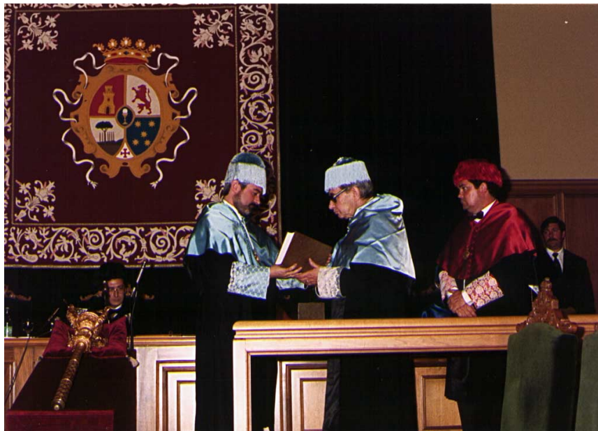
En 1987 la Universidad de Salamanca fue la primera institución académica en nombrar a Don Gonzalo Torrente Ballester doctor honoris causa por Filología. Tras ella llegó la de Santiago de Compostela y la de Borgoña.