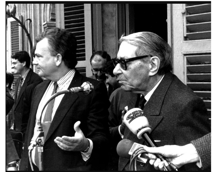
El Ayuntamiento de Salamanca le eligió como pregonero vitalicio de la Feria del Libro. Cada año, desde el balcón de la Plaza Mayor, daba el discurso inaugural para fomentar la lectura entre los salmantinos. "Os invito a recorrer la feria y a compraros el libro que os guste para emprender en soledad y silencio una relación incomparable", dijo en uno de sus pregones.