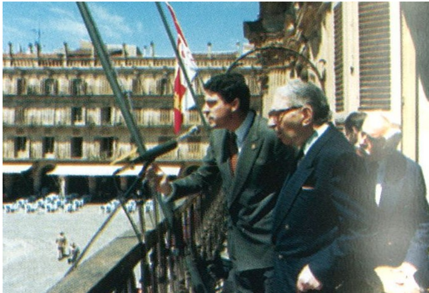
En 1984 fue nombrado por el Ayuntamiento hijo adoptivo de Salamanca