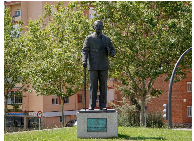
Escultura del escritor situada en la Biblioteca Municipal que lleva su nombre.