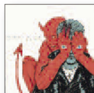
QUEENS OF THE STONE AGE Villains (2017) Rock

El disco de la joven neozelandesa de 20 años es de una gran madurez y maravillosa gama de pop. Desde el de "Green Light" hasta la conmovedora "Liability", el proyecto cautiva y destila momentos de gran brillantez. Para muchos esta millennial es la nueva reina del pop.