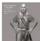
KEVIN JOHANSEN + THE NADA Mis Américas Vol. 1/2 (2016) Cantautores

Jei Beibi es el lugar en donde acumulan toda su experiencia para darnos canciones de todo tipo; esos estilos que han desarrollado a lo largo de 28 años de carrera. Cada canción es una pieza de un puzzle para hacer un disco libre y sin ataduras.