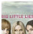
BIG LITTLE LIES VV.AA (2017) Banda Sonora

Con solo 32 años a sus espaldas, el pianista y compositor Alfredo Rodríguez lleva recorrido un largo trecho desde su Habana natal. Ha pasado de ser un joven artista local cubano a ser un nominado al Grammy mundialmente reconocido por trabajos como éste.