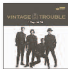
VINTAGE TROUBLE 1 Hopeful Rd. (2017) Rock

Un raro arcoíris musical con duende, un espacio mixto entre la música negra y la gitana, una suerte de colisión neo-rasta por la vía del flamenco y la rumba, una posibilidad jazz entre tanto arte jondo. Post-flamenco por la vía del mestizaje.