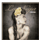
LA NEGRA Colores (2016) Flamenco

Banda sonora imprescindible y una protagonista más de la serie. Las canciones que utilizan suenan muy bien, complementan la visión del director y encima, muchas veces, sus letras tienen que ver con las imágenes que vemos en pantalla.