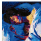
LORDE Melodrama (2017) Pop

El disco de la joven neozelandesa de 20 años es de una gran madurez y maravillosa gama de pop. Desde el de "Green Light" hasta la conmovedora "Liability", el proyecto cautiva y destila momentos de gran brillantez. Para muchos esta millennial es la nueva reina del pop.