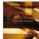
HECTOR ZAZOU & SWARA In the house of mirrors (2008) Música popular

En pocos años y con solo dos discos se han convertido en el grupo revelación del mundo del rock mezclándolo con lo mejor de la música popular del siglo XX: un poco de soul, unos toques de blues, unos tintes de rhythm and blues y un vocalista carismático y solvente.