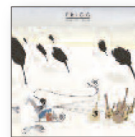
FRIGG Frost on fiddles (2017) Música popular