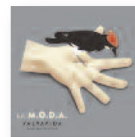
LA M.O.D.A. Salvavida (de las balas perdidas) (2017) Pop

Continúa el singular proyecto de este dúo: didáctico, lúdico y, por supuesto, flamenco. Se aprende jugando y a compás: inglés por medio de una rumba; los números son una colombiana; los colores un garrotín y multiplicar es fácil cuando se canta despacito por alegrías.