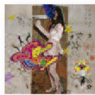
CAFÉ TACVBA Jei Beibi (2017) Pop

Una combinación de rock, balada, toques pop y un poco de oscuridad. Con ritmos no tan crudos como en anteriores producciones, Villains nos invita a un retorno a los años 50, el periodo en el que el rock & roll reinó sin preocupaciones ni oponentes.