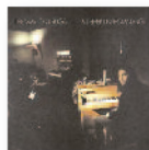
THE WAR ON DRUGS A deeper understanding (2017) Pop / Rock

Eclecticismo, bilingüismo, sutileza de las composiciones... Y mucha música americana. Es la fórmula que siempre ha manejado con éxito Kevin Johansen para conquistar a un público invariablemente fiel. Por algo será uno de los cantautores más respetados.