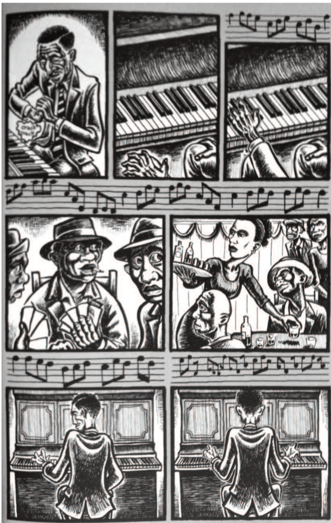
Ilustración, Pablo G. Callejo. En Bluesman / Rob Vollmar