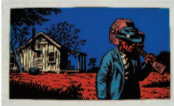
Dibujo de Robert Crumb

Aunque nace en el entorno rural sureño, factores económicos, sociales y culturales, propiciaron una gradual