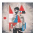
La gran belleza (2020) MARAZU Cantautores CA M

Arcade Fire siempre dará qué hablar. Con su primer álbum para saber que revolucionaron la escena musical, pero no fue hasta el tercer disco que se consolidaron como uno de los colectivos de indie rock más prolíficos y reconocidos a nivel mundial. 'WE' se siente como una fusión entre 'The Suburbs' y 'Reflektor'. Por un lado, reivindica las señas de identidad de la banda, reflexionando sobre el cambio de dimas internos que podemos llegar a tener. Por otro, posee todas las encantadoras idiosincrasias que hacen de Arcade Fire lo que es hoy en día.