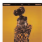
Sometimes I might be introvert (2021) LITTLE SIMZ Rap NM L

Una propuesta intimista en el que estos dos artistas, referentes internacionales del flamenco, nos plantean esa necesidad para contar las cosas más allá de la música, con palabras cercanas, como un susurro al oído. El maestro Montón destaca en su faceta como compositor por su constante búsqueda para fusionar su música con otros estilos con los que conversar desde su raíz flamenca. Y Sandra Carrasco nos regala su torrente de personalidad y voz fuera de horma y su increíble habilidad para lograr que parezca fácil lo difícil en las preciosas canciones compuestas por José Luis Montón.