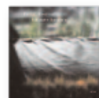
Edizione speciale (2021) ENRICO RAVA Jazz JBS R

Otro paso más adelante en la ya deslumbrante carrera de la heredera natural a la corona del rap británico. En este nuevo proyecto el enfoque minimalista cambia, y la tracklist se dispara hasta las 19 canciones (5 de ellas interludios) y más de una hora de duración. A pesar de estar completamente producido solo por el prestigioso músico Inflo (colaborador de Michael Kiwanuka), la paleta sonora es variada y sorprendente, vi-rando sin complejos entre el soul, funk, jazz, grime o rap pero siempre cohesionado y conectado mediante los excesivamente sobrecargados interludios orquestales.