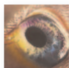
WE (2022) ARCADE FIRE Rock PR A

10 canciones que se anuncian que "huelen a mar, a tierra, a aire y a fuego, a amores libres, a esperanza y a mujeres fuertes". Con libertad estilística, y con la mujer como leit motiv, estas cuatro mujeres músicas, guerreras y viajeras renacen y se reinventan, una y otra vez. 18 años después de su fundación, son ya un pequeño clásico del flamenco más femenino, valiente y alegre. Con una nominación a los Latin Grammy y un reciente Premio de la Música Independiente (MIN) al mejor álbum de flamenco, Las Migas son ya una de las bandas consolidadas más mágicas e internacionales.