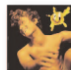
La cantera (2022) GUITARRICADELAFUENTE Cantautores CA G

El trompetista italiano, uno de los grandes nombres del jazz más de vanguardia en la escena europea, y que cuenta ya con 82 años, publica este disco grabado en vivo en el Jazz Middelheim de Amberes en el año 2019. En aquella actuación el maestro italiano se rodeó de algunos de los músicos más destacados de la escena jazzística italiana. Cuatro son temas propios y los dos que se salen de la norma son una larga versión del 'Once Upon A Summertime' de Michel Legrand y una delirante versión del mítico bolero 'Quizás, quizás, quizás'.