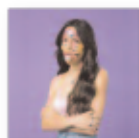
Sour (2022) OLIVIA RODRIGO Pop PR R