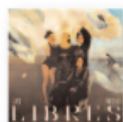
Libres (2022) LAS MIGAS Flamenco FL M

10 canciones que se anuncian que "huelen a mar, a tierra, a aire y a fuego, a amores libres, a esperanza y a mujeres fuertes". Con libertad estilística, y con la mujer como leit motiv, estas cuatro mujeres músicas, guerreras y viajeras renacen y se reinventan, una y otra vez. 18 años después de su fundación, son ya un pequeño clásico del flamenco más femenino, valiente y alegre. Con una nominación a los Latin Grammy y un reciente Premio de la Música Independiente (MIN) al mejor álbum de flamenco, Las Migas son ya una de las bandas consolidadas más mágicas e internacionales.