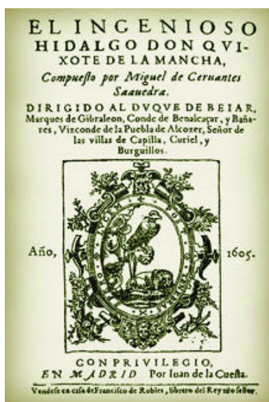
Portada de la 1ª edición de don Quijote de la Mancha

Mi guel de Cervantes Saavedra 5 a edición Barcelona, 1895