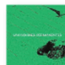
Vacaciones permanentes (2024) VACACIONES PERMANENTES Músicos locales PR V

Una gran amplitud de variaciones musicales creando una atmósfera única y envolvente. Una de las experiencias sonoras más estimulantes y memorables del año para una de las películas más espectaculares del año.