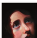
Sinister gift (2025) PANDA BEAR Nuevas músicas NM P

Su segundo álbum consolida el estilo que lo consagró como una de las voces más cautivadoras. Cada tema parte de la tradición, pero acaba transformándose y evolucionando hacia algo totalmente inesperado y que confiere al álbum su toque distintivo: atemporal pero inconfundiblemente original.