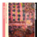
Armageddon flower (2025) IVO PERELMAN & MATTHEW SHIPP STRING TRIO Jazz JBS P

Un disco de una sinceridad desgarradora. Un trabajo del que no se desprende ningún artificio, resulta puro y cristalino. En lo que respecta a pericia instrumental y construcción de melodías Isbell es imbatible. Ese es su punto fuerte. Además de lo que dice, el mayor mérito está en cómo toca lo que dice.