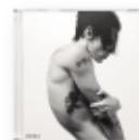
Idols (2025) YUNGBLUD Rock PR Y