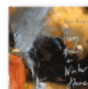
Honey from a winter stone (2025) AMBROSE AKINMUSIRE Jazz JBS A

En un panorama musical plagado de clones, descubrir voces auténticas se convierte en un auténtico soplo de aire fresco. Yungblud es el altavoz de la disconformidad juvenil y el CD destila una energía honesta y valiente, desplegando una visceralidad que captura al oyente desde el primer acorde.