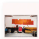
No Title As Of 13 February 2024 28,340 Dead (2024) GODSPEED YOU! BLACK EMPEROR Rock PRG

Reúne al saxofonista tenor con el renombrado Matthew Shipp String Trio. El álbum se adentra en los reinos del jazz de vanguardia, presentando una serie de piezas de improvisación que destacan la sinergia cohesiva y el virtuosismo individual del cuarteto.