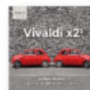
Vivaldi X2: double concertos for flute, oboe, violin and cello (2024) LA SERENISSIMA Música clásica MC S