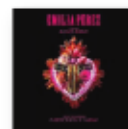
Emilia Pérez. Original motion picture soundtrack (2020) CLÉMENT DUCOL & CAMILLE Bandas sonoras BSO E

Esta nueva propuesta de los especialistas barrocos La Serenissima combina varios conciertos dobles de Antonio Vivaldi con obras para violín, violonchelo, oboe, flauta dulce y continuo. Son algunas de las obras más coloridas y alegres de Vivaldi.