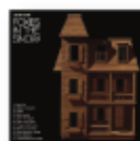
Foxes in the snow (2025) JASON ISBELL Cantautores CA I

Un disco de una sinceridad desgarradora. Un trabajo del que no se desprende ningún artificio, resulta puro y cristalino. En lo que respecta a pericia instrumental y construcción de melodías Isbell es imbatible. Ese es su punto fuerte. Además de lo que dice, el mayor mérito está en cómo toca lo que dice.