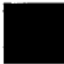
Pantone 484 C