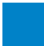
Pantone 3005 C