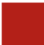
Pantone 484 C