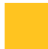
Pantone 123 C