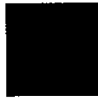
Pantone 3005 C