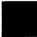
Pantone 484 C