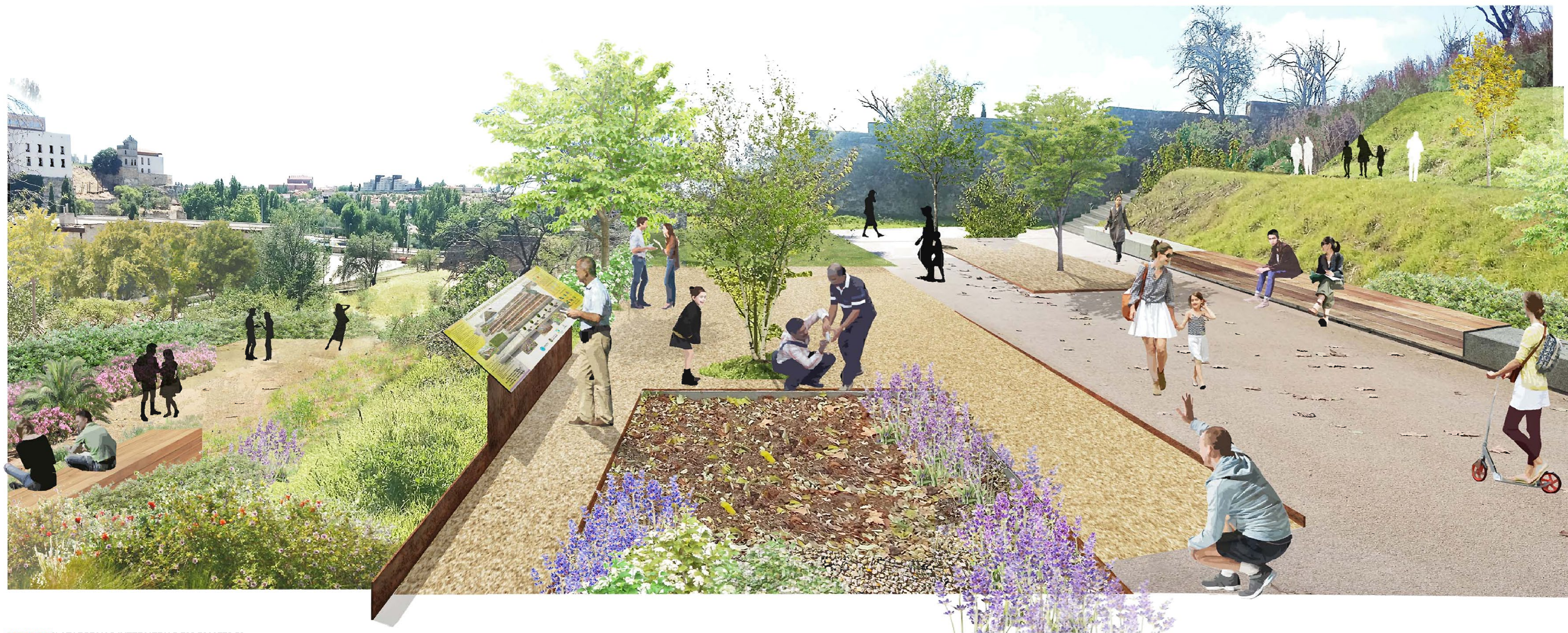
VISTA 3 | PLATAFORMAS INTERMEDIAS 762,50 Y 779,50