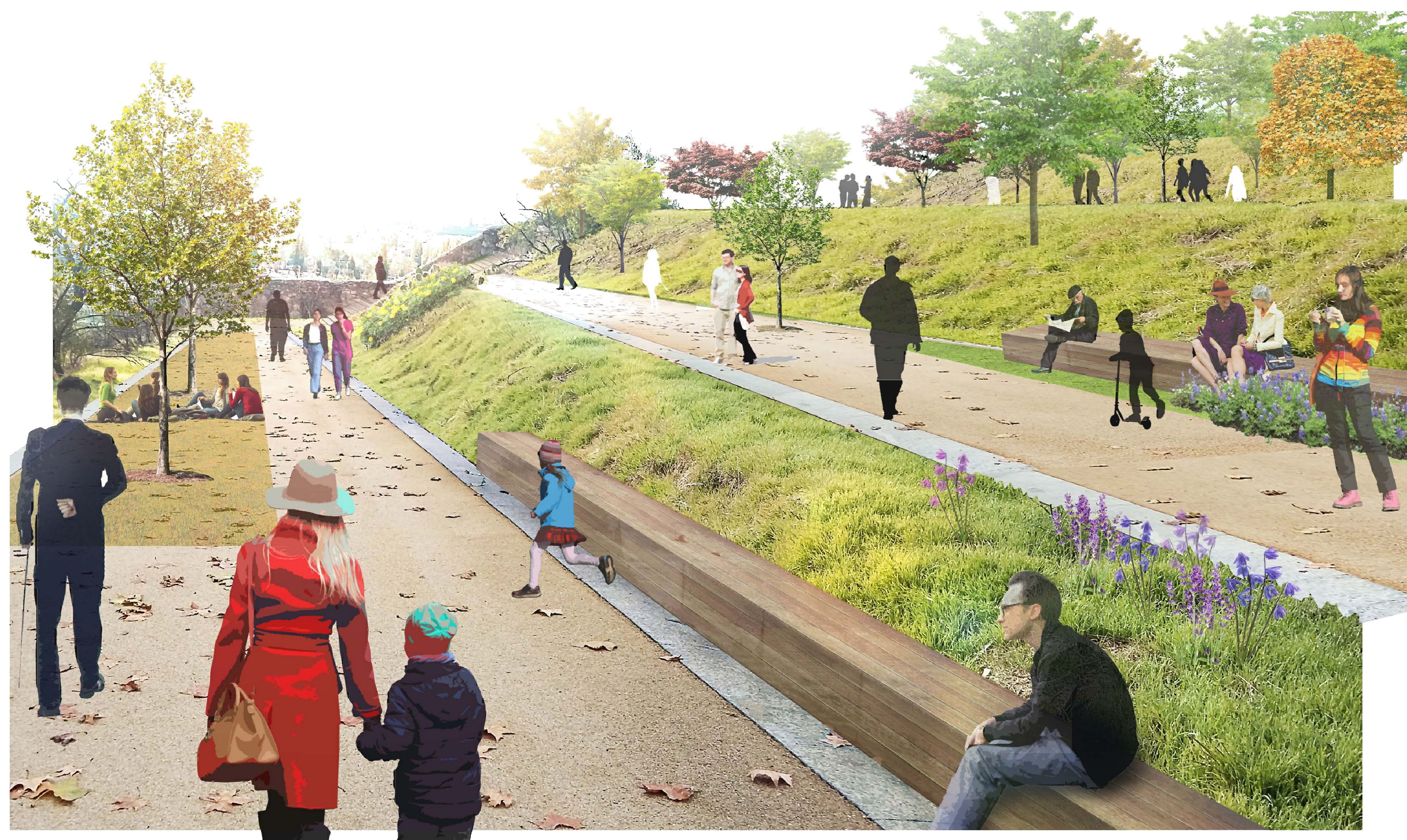
VISTA 2 | PLATAFORMAS INTERMEDIAS 792,50 Y 795,00