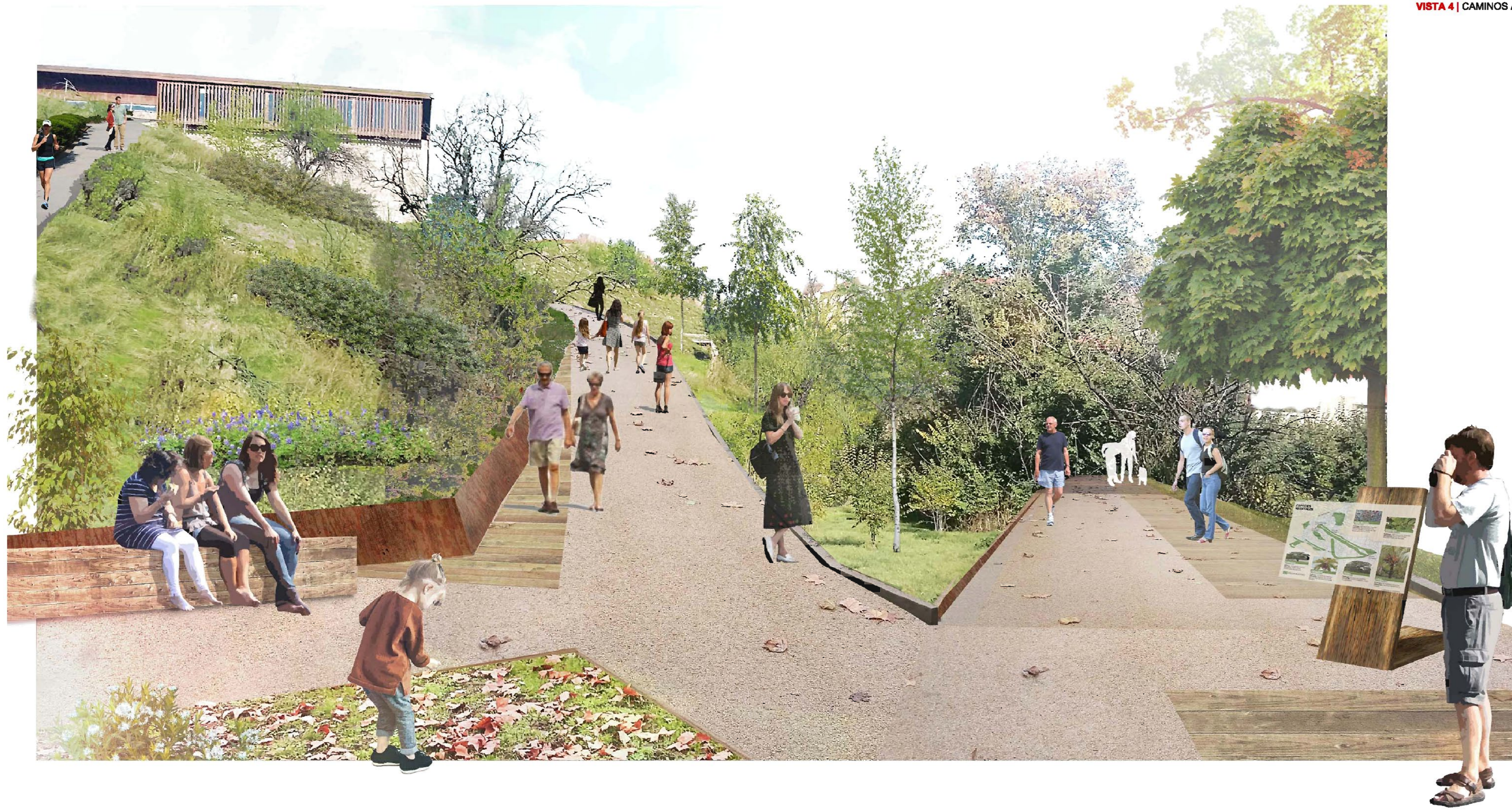
VISTA 4 | CAMINOS ACCESO A PLATAFORMA SUPERIOR D3 Y D4