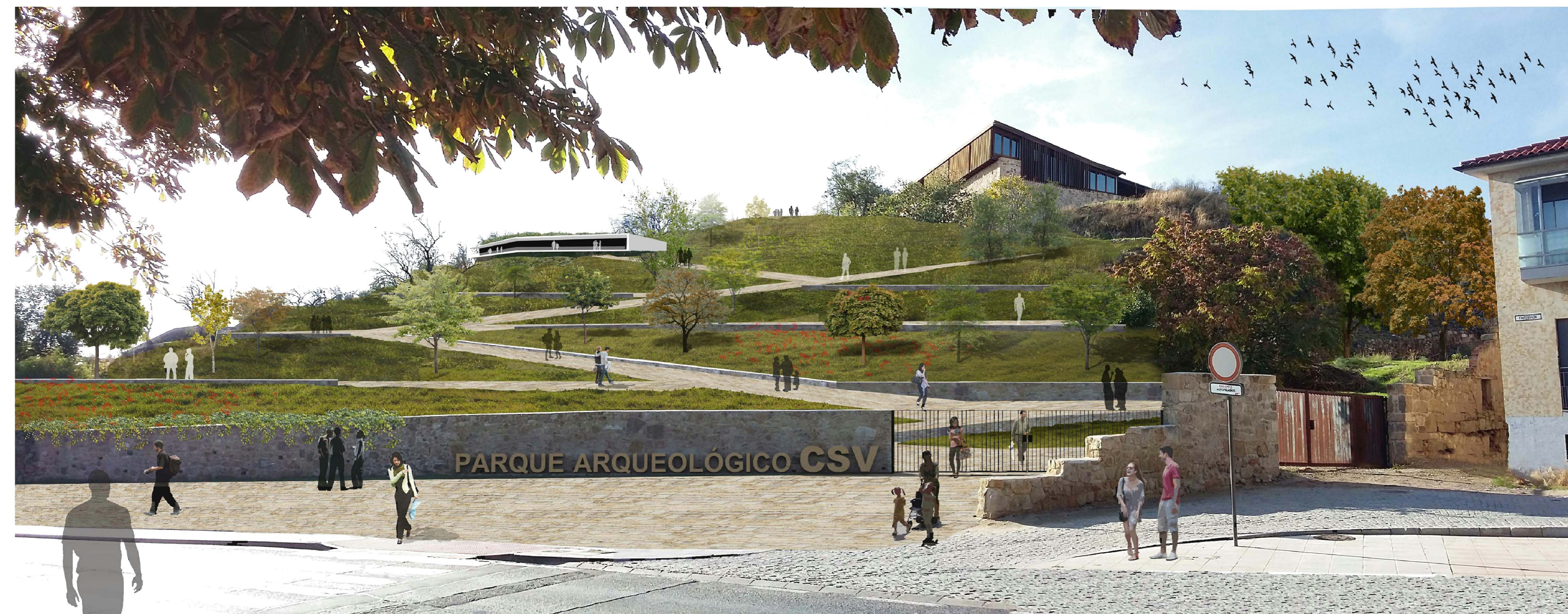
VISTA 1 | PLAZA ACCESO VAGUADA DE LA PALMA 777,50