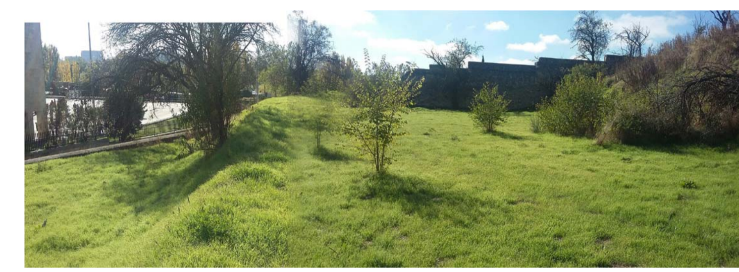
ZONA 1 | ACCESOS LADERA VAGUADA DE LA PALMA ESTADO ACTUAL