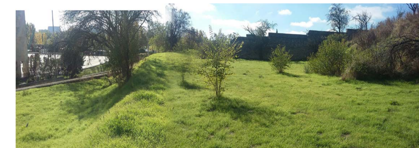
ZONA 1 | ACCESOS LADERA VAGUADA DE LA PALMA ESTADO ACTUAL