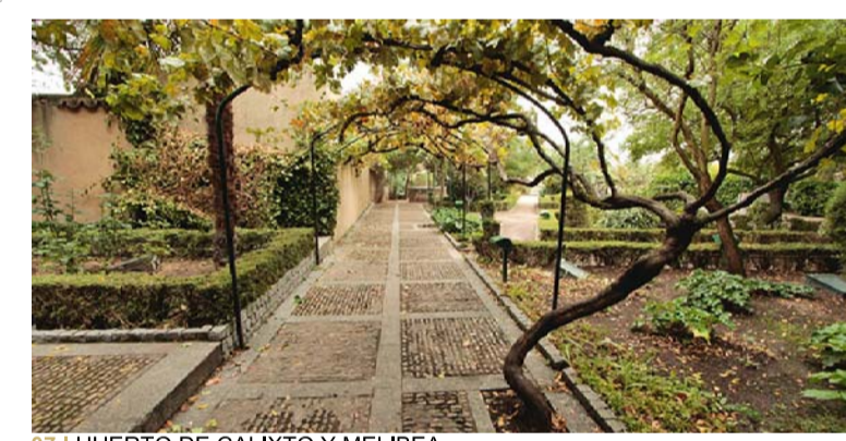
07 | HUERTO DE CALIXTO Y MELIBEA