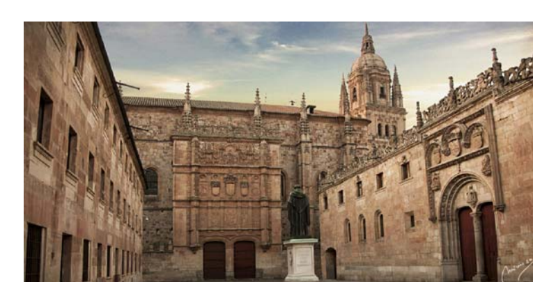
04 | PATIO DE ESCUELAS