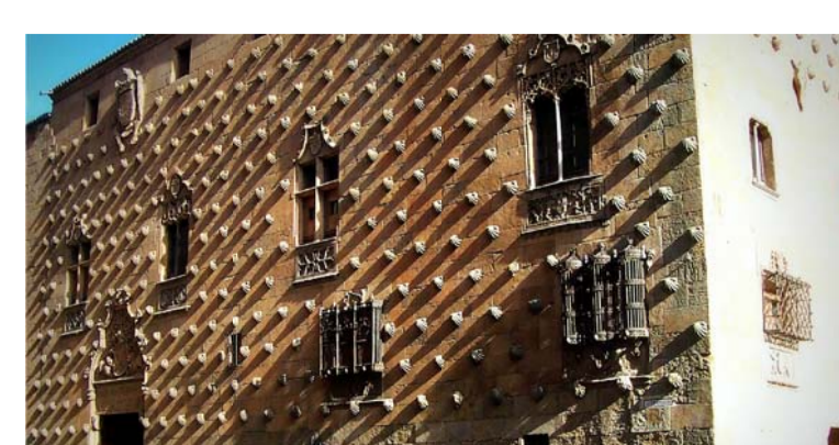
02 | CASA DE LAS CONCHAS