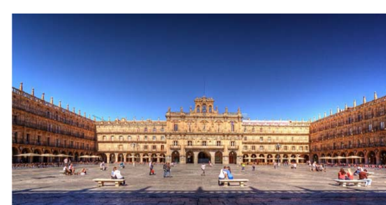
01 | PLAZA MAYOR