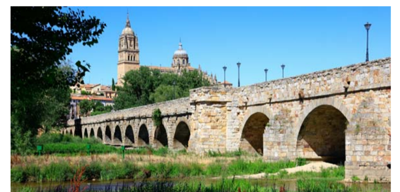
09 | PUENTE ROMANO