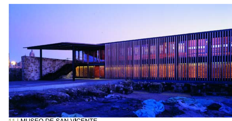
11 | MUSEO DE SAN VICENTE