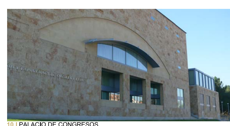
10 | PALACIO DE CONGRESOS