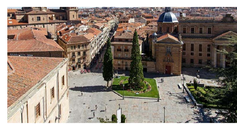
05 | PLAZA DE ANAYA