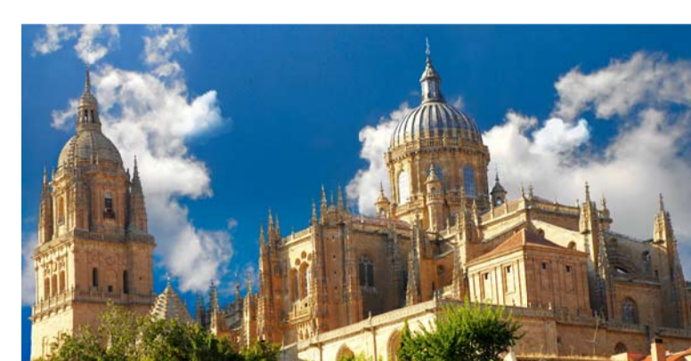
06 | CATEDRAL