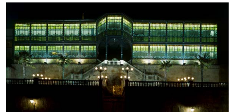
08 | CASA LIS