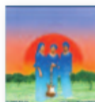
LES FILLES DE ILLIGHADAD Eghass Malan (2017) Música popular

Un álbum inesperado y conceptual, apabullante y apasionado, pergeñado por los nietos de los que lo perdieron todo en el 39. Cantado en su totalidad en euskera y sobre un ritmo maquinal, oscuro y crudo que invita a salir a las calles, para reclamar otra realidad y al precio que sea. Un disco importante y valiente, de gran calibre.