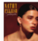
NATHY PELUSO La Sandunguera (2018) Rap

Su primer álbum de estudio. Un trabajo ecléctico y variado repleto de intensas y crecientes melodías folk con un uso de sinfónicos coros que empujan y motivan al más apático. La diversidad de géneros y letras de esta banda islandesa pueden evocar desde Mumford & Sons a Beirut o Arcade Fire. Un álbum que engancha y crece con las escuchas.