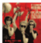
FERMÍN MUGURUZA ETA THE SUICIDE OF WESTERN CULTURE B-Map 1917 + 100 (2017) Pop-rock