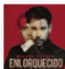
MIGUEL POVEDA EnLorqucido (2018) Flamenco

Un homenaje a Federico García Lorca. Poveda une y mezcla elementos de rock y sinfónicos con el flamenco. "Deseo que con este disco puedan viajar por el universo de los miles de Federicos que existen: el entusiasta, alegre, triste, comprometido, viajero, premonitorio, amante de lo culto y lo popular y obsesionado con la muerte, pero también con la vida"