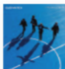
ELEFANTES La primera luz del día (2018) Pop-rock