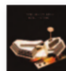
ARCTIC MONKEYS Tranquility Base Hotel + Casino (2018) Pop-rock

La nueva revelación del neo-soul español. Lo demuestra su primer EP: cinco canciones, compuestas por ella y cantadas en inglés con una voz aguda y finamente afilada. Sus influencias son muy reconocibles y se pueden rastrear referentes tan variados como Lauryn Hill o Billie Holiday. Un debut más que esperanzador que da a la música negra que se hace en España la visibilidad que se merece.