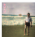
OF MONSTERS AND MEN My head is an animal (2012) Pop-rock