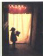
Primer premio colección