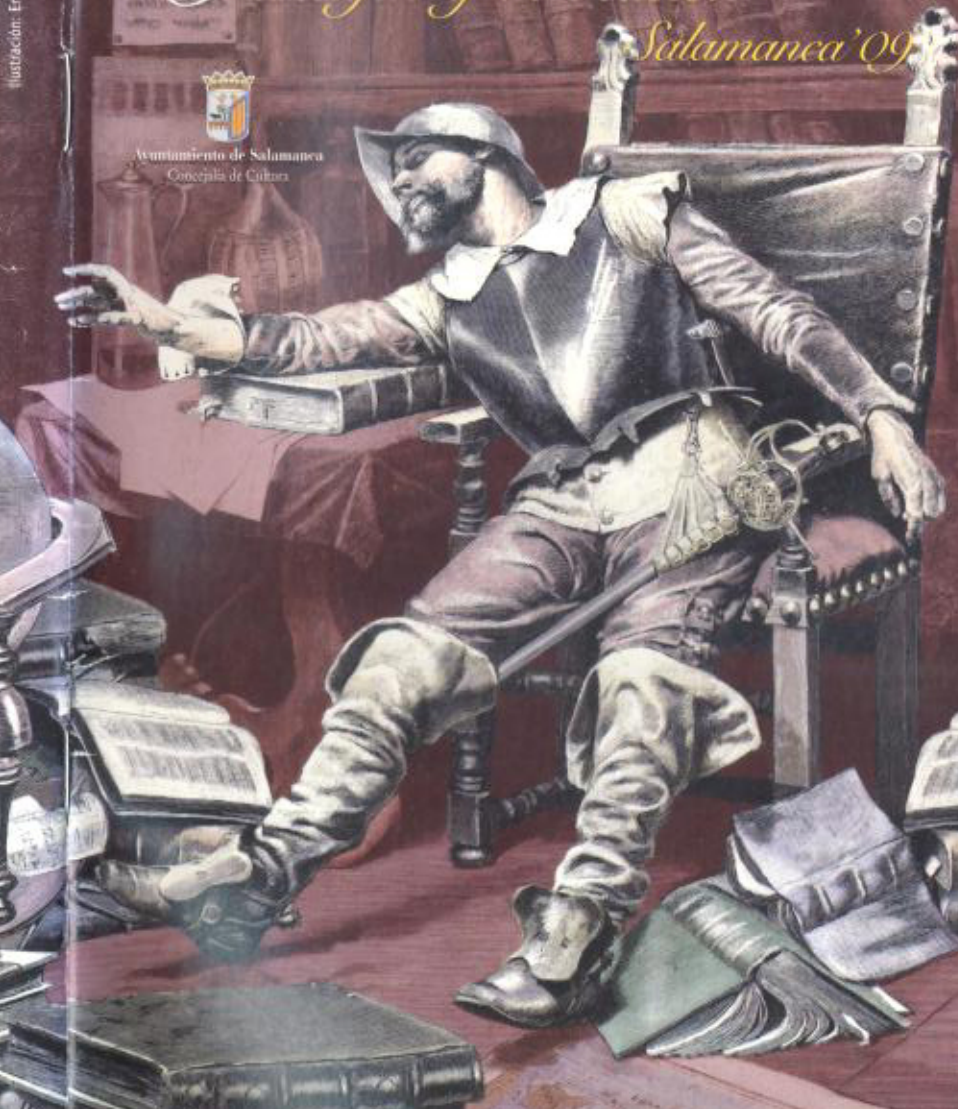
Ilustración: Enrique Serra, Roma 1882

Ayuntamiento de Salamanca Concejalía de Cultura