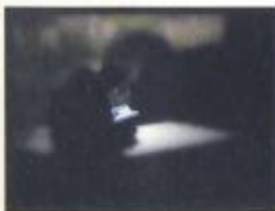
Primer premio individual

Lugar: Espacio municipal de exposiciones. Plaza Mayor Horario: Lunes a viernes de 11,30 a 14,00 h. y de 18,00 a 21,00 h. Sábados, domingos y festivos de 11,30 a 14,30 h. y de 18,00 a 21,30 h.