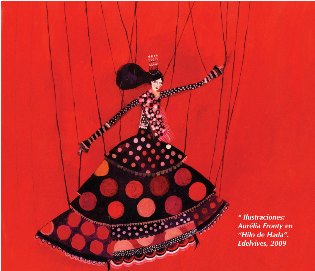
* Ilustraciones: Aurélia Fronty en "Hilo de Hada". Edelvives, 2009