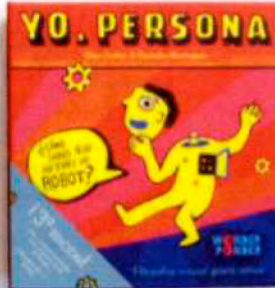
Yo, persona (2015)