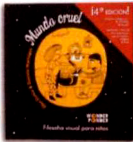
Mundo cruel (2014)