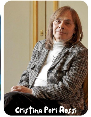
Cristina Peri Rossi