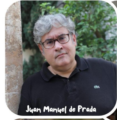
Juan Manuel de Prada