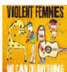
VIOLENT FEMMES We can do anything (2016) Pop-rock

El álbum mezcla de manera natural su vertiente de autor, íntima, personal e intransferible, con otra en la que rinde un homenaje a las raíces con las que ha crecido musicalmente. Interioriza de manera brillante la sonoridad del folk americano y la reinterpreta con un estilo personal. Un disco redondo, con las colaboraciones de Neil Halstead y de Basia Bula.