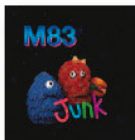
M83 Junk (2016) Nuevas músicas

Una obra titánica y, quizá, algo intimidante y difícil de digerir en todos sus detalles en las primeras escuchas. Un trabajo fresco, honesto, sin sobreproducciones ni maquillajes, con temas más largos y a veces complejos. Maiden reinventa sus zonas cómodas y se va imponiendo nuevos desafíos, que cumple con la suficiencia, vigencia y supremacía de los verdaderos campeones.