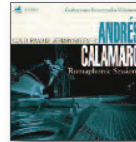
ANDRÉS CALAMARO Romaphonic Sessions (2016) Pop-rock

Un disco que se mueve entre la épica y el pop retro, aderezado con electrónica minimalista y temas que te encogen el corazón. Un álbum de sentimientos, cargado de temas políticos pero llevados desde una perspectiva emocional: la crisis, la guerra, las injusticias... Un trabajo reflexivo que invita a pasear bajo la lluvia.