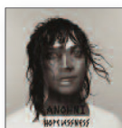
ANOJNI Hopelessness (2016) Pop-rock