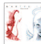
NATOS y WAOR Martes 13 (2015) Nuevas músicas

Estambul: una encrucijada entre Europa y Asia. El disco presenta las músicas instrumentales 'cultas' de la corte otomana del siglo XVII, basándose en la obra de Dimitrie Cantemir, en diálogo y alternancia con las músicas populares, representadas por las tradiciones orales de los músicos armenios y de las comunidades sefardíes.