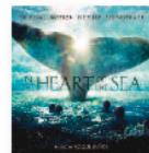
ROQUE BAÑOS In the heart of the sea (2015) Bandas sonoras

El director quería "que cada pieza de música fuera única y pareciera un tema fuerte y lo bastante independiente". Pemberton combina la nitidez y la sofisticación actual con la esencia de los 60, logrando un sonido simple y memorable que subraya, acompaña e impulsa los acontecimientos de esta película de acción.