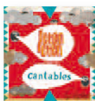
FETÉN FETÉN Cantables (2016) Música popular

Es su primer álbum en dieciséis años. Un trabajo divertido y ecléctico, sobre todo acústico, que combina el punk-rock de sus comienzos. Se han mantenido fieles a su sonido, a la estética con la que se dieron a conocer y parece que no haya pasado el tiempo. Pero se echan de menos temas nuevos, frescos y con gancho que dieron nombre y sitio a la banda.