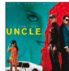
DANIEL PEMBERTON The man from U.N.C.L.E. (2015) Bandas sonoras