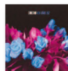
CHUCHO Los años luz (2016) Pop-rock

Ron Howard y Roque Baños, dos maestros de la emoción, unen esfuerzos para llevar a buen puerto esta costumbrista radiografía de las artes marinas del siglo XIX. Aunque Baños ha seguido las pautas del director, no ha perdido su identidad y ha creado sonoridades nuevas, únicas, buscando que la música tuviera un sonido ancestral, grande, misterioso y contundente.