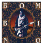
BOMBINO Azal (2016) Música popular

Un nuevo paso adelante de la banda gallega que, sin renunciar a su personalidad sonora, aspira a radicalizar su discurso. En un gran estudio y con tiempo para planificar y matizar, han editado su cuarto disco. Un trabajo de estructuras cambiantes e inesperados giros rítmicos. Una válvula de escape para un grupo que entiende su carrera como un proyecto a largo plazo.