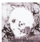
RADIOHEAD A moon shaped pool (2016) Pop-rock

Su voz poderosa, aterciopelada y sutil, nos regala un disco pleno de experiencia y aventura, donde no hay miedo a experimentar y avanzar en su peculiar universo. En él reinterpreta clásicos junto a temas compuestos para su portentosa garganta, elevando el fado a un nivel pasional y colorista o atreviéndose con ritmos tribales de cadencia criolla.