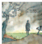
JAMES BLAKE The colour in anything (2016) Nuevas músicas

Blake construye sin artificio un relato en el que abunda el tono confesional. Un álbum con un inicio tan impactante como el de "Radio Silence", "Points" y "Love Me In Whatever Way": tres temas que muestran la diversidad de este trabajo, combinando tensión, profundidad, delicadas líneas de piano y la clase desbordante que ya conocíamos.