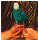
ANDREW BIRD Are you serious (2016) Cantautores

Los últimos años han sido especialmente intensos en la vida de Andrew Bird, un puñado de experiencias que han hecho de este disco el más expuesto y directo de su trayectoria. Puede que sea un disco confesional, pero solo como podría hacerlo el músico de Illinois, con un sentido del humor que tiene su mejor reflejo en "Left Handed Kisses", a dúo con Fiona Apple.