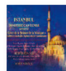
JORDI SAVALL Istanbul: Dimitrie Cantemir 1673-1723 (2009) Música clásica