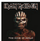
IRON MAIDEN The book of souls (2015) Pop-rock

Los últimos años han sido especialmente intensos en la vida de Andrew Bird, un puñado de experiencias que han hecho de este disco el más expuesto y directo de su trayectoria. Puede que sea un disco confesional, pero solo como podría hacerlo el músico de Illinois, con un sentido del humor que tiene su mejor reflejo en "Left Handed Kisses", a dúo con Fiona Apple.