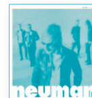
NEUMAN If (2014) Pop-rock