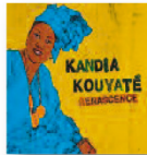
KANDIA KOUYATÉ Renaissance (2015) Música popular

Es la primera banda sonora completa para una película de Tarantino, con el que ya había colaborado en otras cuatro ocasiones. Después de 40 años y a pesar de los desencuentros con el director, Morricone ha vuelto a componer la música de un western, con la que ha ganado un Globo de Oro y el Oscar a la mejor banda sonora original.