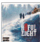
ENNIO MORRICONE The h8teful eight (2015) Bandas sonoras

Un trabajo menos impactante que "Hurry Up, We're Dreaming", con el que entró en historia de la música electrónica. Si bien resulta muyailable, es más relajado y dotado de un ambiente chill. Está conformado por muestras de varios géneros que convergen en un pop electrónico que a veces se acerca mucho a los sonidos del mainstream.