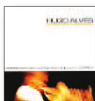
HUGO ALVES Estranha natureza (2003) Jazz

Su noveno álbum de estudio. Los temas muestran preocupación por la crisis ambiental, la inconciencia de las masas, el fin de los amores y la lucha por seguir adelante. Hay mareas sombrías en medio de fondos con pianos suaves, guitarras acústicas y una orquesta de cuerdas. Se trata de Radiohead, y la belleza de su música siempre está envenenada de temor.