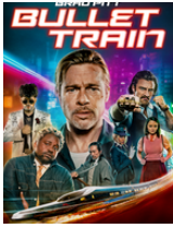
BULLET TRAIN (2022) David Leitch DVD ACC bul

Basada en la novela de Kōtarō Isaka que ya tuvo una versión teatral japonesa en 2018, Bullet Train presenta a Ladybug, interpretado por Brad Pitt, un asesino con mala suerte decidido a llevar a cabo sus cometidos de manera pacífica tras demasiados “trabajos” que han salido mal. El destino, en cualquier caso, tiene otros planes para él al colocarle en su última misión en una vía de colisión con adversarios letales venidos de alrededor del planeta (cinco asesinos a sueldo que tienen que cumplir misiones muy relacionadas entre sí) en el tren más rápido del mundo que viaja de Tokio a Morioka. El director, David Leitch, responsable de títulos como John Wick o Dead Pool 2 , mezcla acción, violencia y personajes muy potentes, consiguiendo una película con un ritmo trepidante en la que, sin embargo, se apuesta por el humor por encima de todo. Pura diversión.