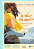
EL TECHO DEL MUNDO Rémi Chayé (2017) DVD DIB tec

Cooper, Gordon y Shepherd son tres viejos científicos que de pequeños quedaron maravillados por las teorías de la vida en Marte de Percival Lowell. Su sueño desde entonces es llegar al planeta rojo y para ello formaron el Club de los Jóvenes Científicos , en el que llevan toda su vida y con el que mantienen su amor por la vida y un sueño para seguir adelante. En sus constantes inventos para lograrlo, involucran a Jack, el marido de Windy, hija de Gordon, quien siempre se queda al margen de las locuras de su padre y sus amigos. Sin embargo, algo cambiará en ella para que les ayude en la que puede ser la aventura definitiva. Miniserie de tres capítulos basados en algunos de las historias del manga de Kenji Tsurata.