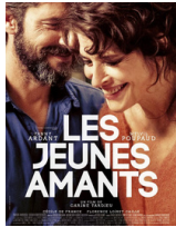
LOS JÓVENES AMANTES (2021) Carine Tardieu DVD DRA jov

Basada en la novela de Kōtarō Isaka que ya tuvo una versión teatral japonesa en 2018, Bullet Train presenta a Ladybug, interpretado por Brad Pitt, un asesino con mala suerte decidido a llevar a cabo sus cometidos de manera pacífica tras demasiados “trabajos” que han salido mal. El destino, en cualquier caso, tiene otros planes para él al colocarle en su última misión en una vía de colisión con adversarios letales venidos de alrededor del planeta (cinco asesinos a sueldo que tienen que cumplir misiones muy relacionadas entre sí) en el tren más rápido del mundo que viaja de Tokio a Morioka. El director, David Leitch, responsable de títulos como John Wick o Dead Pool 2 , mezcla acción, violencia y personajes muy potentes, consiguiendo una película con un ritmo trepidante en la que, sin embargo, se apuesta por el humor por encima de todo. Pura diversión.