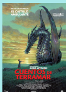
CUENTOS DE TERRAMAR Goro Miyazaki (2006) DVD DIB cue

El techo del mundo , nos trae una aventura emotiva y trepidante de una heroína espléndida, en esta película europea de animación para toda la familia.