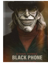
BLACK PHONE (2021) Scott Derrickson DVD TER bla

La última película de la directora francesa Carine Tardieu relata la historia de Pierre un joven oncólogo de prestigio, casado y con dos hijos, y su enamoramiento progresivo pero desbocado por Shauna, una arquitecta retirada, que se conocieron 15 años atrás pero es en el reencuentro cuando se enciende la chispa del deseo. Tardieu, con sobriedad de la puesta en escena y por la mesura de las interpretaciones, que nunca caen en la sensiblería ni la afectación artificial o exagerada, celebra el derecho de la mujer al amor, al deseo y al goce, independientemente de la edad. La irrupción en la trama de la enfermedad es un obstáculo más que deben sortear los protagonistas y que hace virar la pasión romántica hacia el cuidado. Como en todo buen melodrama, estamos frente a unos amantes que no deberían estar juntos, pero que tampoco pueden vivir separados.