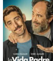
LA VIDA PADRE (2022) Joaquín Mazón DVD COM vid

Basada en un cuento de Joe Hill, en Black Phone un sádico asesino con máscara (un sorprendente Ethan Hawke) secuestra a Finney Shaw, un chico tímido e inteligente de 13 años, y le encierra en un sótano insonorizado donde de nada sirven sus gritos. Cuando un teléfono roto y sin conexión empieza a sonar, Finney descubre que a través de él puede oír las voces de las anteriores víctimas, las cuales están decididas a impedir que Finney acabe igual que ellas. Ambientada en 1978, con un asesino que parece inspirado en John Wayne Gacy y muchas influencias de la obra de Stephen King, Scott Derrickson vuelve al terror con su guionista C. Robert Cargill con una historia naíf y turbia a partes iguales y que ofrece predecibles (y disfrutables) sustos.